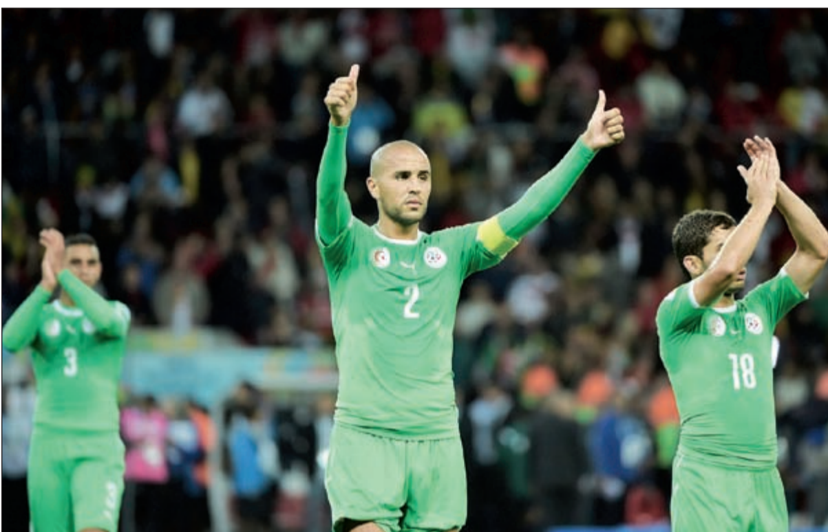
ترفعون الرايس يا الخضر

أصبح منتخب الجزائر رسمياً أكثر منتخبات عربي يخوض دقائق لعب في بطولة واحدة من بطولات كأس العالم، وذلك بعد أن تعادل سلسبيا مع ألمانيا في الشوطين الأول والثاني.