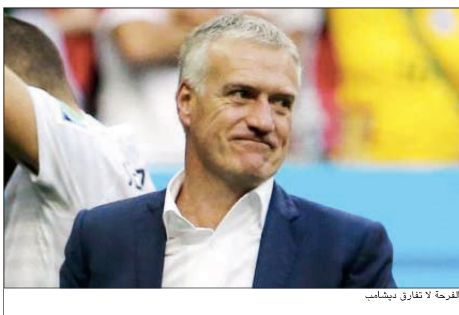
الفرحة لا تفارق ديشامب