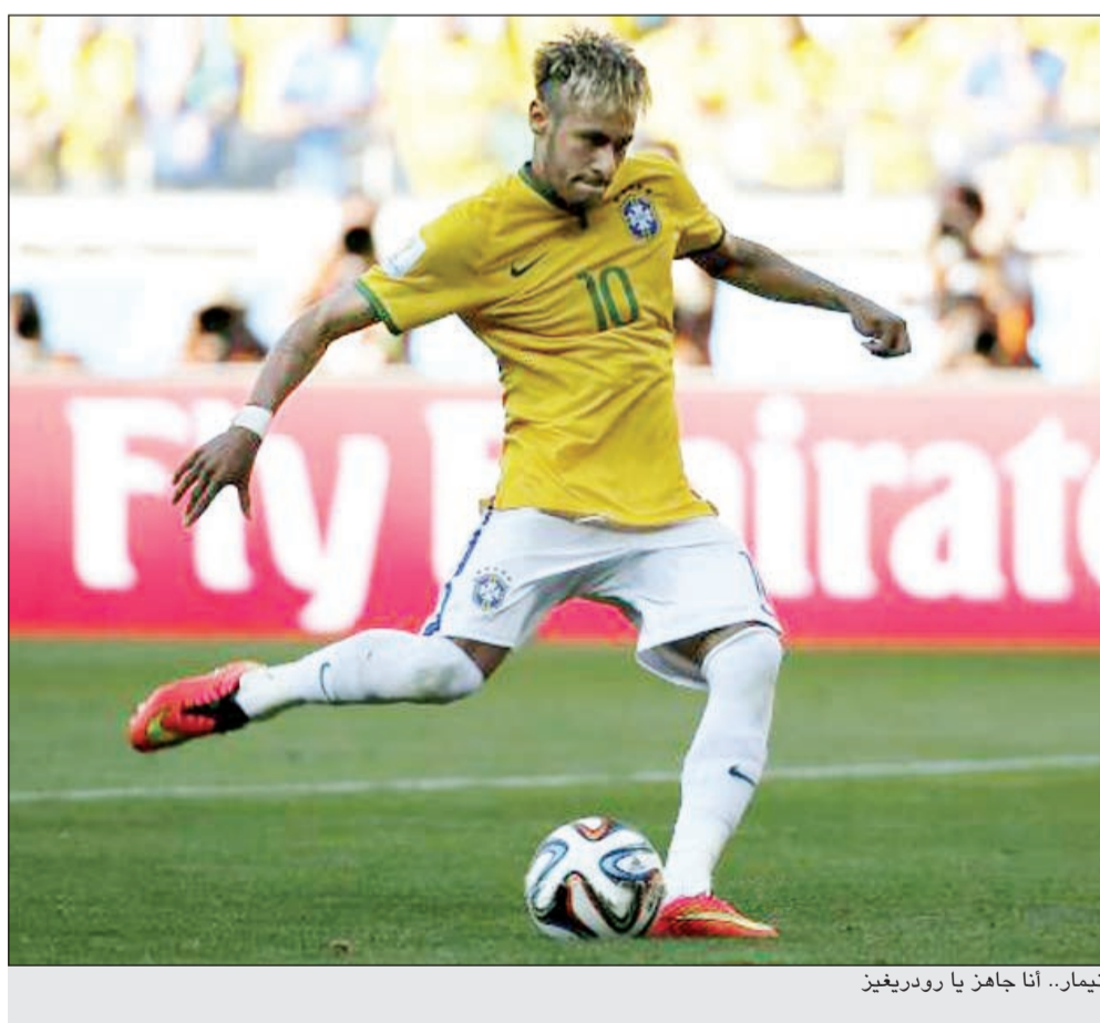
نيمار.. أنا جاهز يا رودريغيز

أكد لاعب وسط المنتخب البرازيلي فرناندينو أن «السليسياس» لا يزال المرشح الأقوى للفوز بالمونديال، بعد الانتقادات التي وجهت للفريق إثر المستوى الذي ظهر به أمام تشيلي في دور الـ 16، في المباراة التي احتكم فيها المنتخبان إلى ركلات الترجيح، بعد التعادل بهدف لكل منهما في الوقتين الأصلي والإضافي. وقال فرناندينو في مؤتمر صحافي، «ما تقوله دور المراهبات بالنسبة لنا لا يمثل فارقا كبيرا، في تقديري البرازيل هي المرشحة للقب، كلما شاركت في مسابقة إلا وتكون مرشحة للقب».