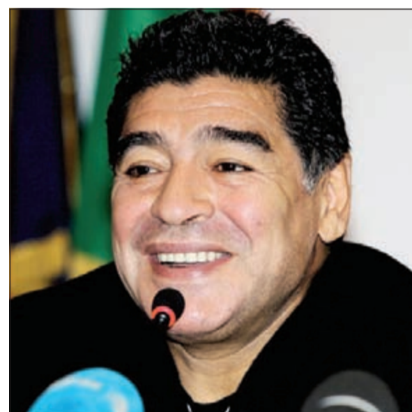
مارادونا يقلل من شأن الألمان