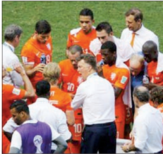
راحة هولندية من شدة الحر

أثار الطقس الحار في مدينة فورتاليزا أثناء مباراة هولندا والمكسيك في دور الـ16 من مونديال البرازيل تساؤلات ومخاوف حول تنظيم أي مونديال بعد ذلك في بلد بها أجواء حارة خاصة في قطر عام 2022.