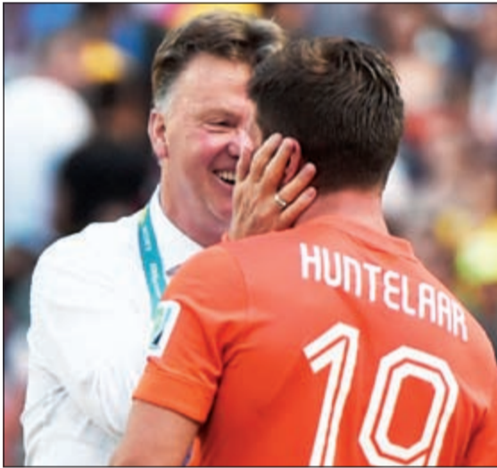
فان غال.. تكتكتها صح