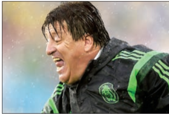
صرخت وصفت وسقطت على الأرض

نشرت صحيفة التلغراف الإنجليزية مجموعة من الصور لأغرب تعابير الوجه أثناء منافسات كأس العالم المقامة حالياً في البرازيل. اللاعبون يركزون ويضعون كل ما لديهم في اللعب، ولا يكتفون بما قد يصدر عنهم من تعابير وجه، ولكن المصورين يصطادون لحظات غريبة، لتكون صوراً عالية الشعبية وسريعة الانتشار. كريستيانو رونالدو تم اختياره كصاحب الصورة رقم 1 الأكثر غرابة من قبل الصحيفة الإنجليزية، التي نشرت مجموعة من الصور ضمت أسماء لنجوم آخرين مثل مسعود أوزيل. ويعد كأس العالم بمنزلة العرس الكروي والمهرجان، فالمسألة فيه لا تتوقف على لعب كرة القدم والنتائج فحسب، بل جرت العادة رصد الجماهير والتاريخ وأمور أخرى عديدة منها... تعابير الوجه.