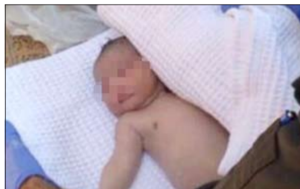
جثة الرضيع بعد المعاينة