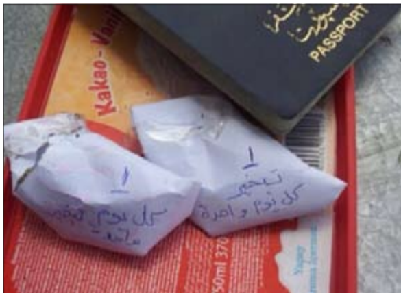
ادوات السحر والشعوذة المضبوطة

أحال رجال جمارك منفذ العبدلي وافدا من الجنسية العراقية إلى التحقيق معه على خلفية العثور معه على كمية من الطلاس. وقال مصدر جمركي ان رجال جمارك العبدلي أثناء تفتيش معتاد لإحدى حقائب وافد عراقي بطريقه إلى الدخول للكويت اشتبه رجال الجمر كيكس عُثر عليه داخل حقيبة الوافد وقد كتب عليها طلاس وشعوذة، حيث أفاد المتهم بجلب السحر بأنه لا يعرف شيئاً عن الكيس الذي عُثر بداخله على الطلاس والتي قال إنها كتابات لا تشكل أي شبه، فتم رفع تقرير بالواقعة.