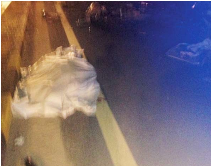
جثة المواطن تنتظر الطب الشرعي وتبدو آثار الحادث

لفظ مواطن انفاسه الاخيرة اول ايام شهر رمضان الفضيل جراء حادث تصادم على طريق الدائري السادس السريع في اول ايام رمضان متاثرا بجراحه وتم تسجيل قضية حملت مسمى تصادم ووفاة. وفي التفاصيل التي يرويها مصدر امني ان بلاغا ورد الي غرفة عمليات الداخلية من المارة يفيد بوقوع حادث تصادم مروع مقابل منطقة سعدالعبدالله وعليه توجه رجال الامن والاسعاف والاطفاء، حيث تم اخراج قائد احدى المركبات الذي انحشر بسبب الحادث واتضح بأنه متوفى نتيجة الاصطدام وأفاد المصدر بأن رجال الامن عُثروا على اثبات الشخص المتوفى واتضح أنه مواطن فيما نقل الطريف الآخر إلى المخفر وسجلت قضية.