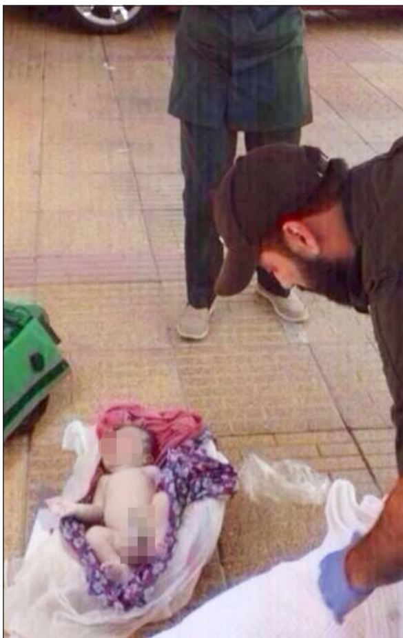
رجال الأدلة الجنائية يرفعون الآثار حول جثة الرضيع

رفع رجال الأدلة الجنائية جثة طفل إلى الطب الشرعي للوقوف على هوية والدته التي تركته بكيس قمامة قرب جمعية الرميثية، وتم تسجيل قضية. وفي التفاصيل التي يرويها مصدر أمني أن بلاغا ورد إلى غرفة عمليات الداخلية مساء أمس الأول عن وجود طفل داخل كيس قمامة وبجانب حاوية بمنطقة الرميثية، وعلى الفور توجه رجال الإسعاف والأمن، وتبين أن الطفل مكتمل النمو وقد فارق الحياة، وعليه تم إخطار الطب الشرعي الذي قام بنقل الجثة وعمل تحليل الـ dna تهميدا لضبط المشتبه بهم بإلقاء الطفل وقتله، وعمل مطابقة بين الحمض النووي للطفل والحمض النووي للمشتبه بهم. ومن المقرر أن يقف الطب الشرعي على ما إذا كانت الوفاة ناتجة عن حرارة الطقس أم أن الطفل مات قبل التخلص من جثة، إما ان الأم قتلت الرضيع لاقسوة متناهية لتطمس معالم جريمة أقل وطأة من قتل طفل لا حول له ولا قوة.