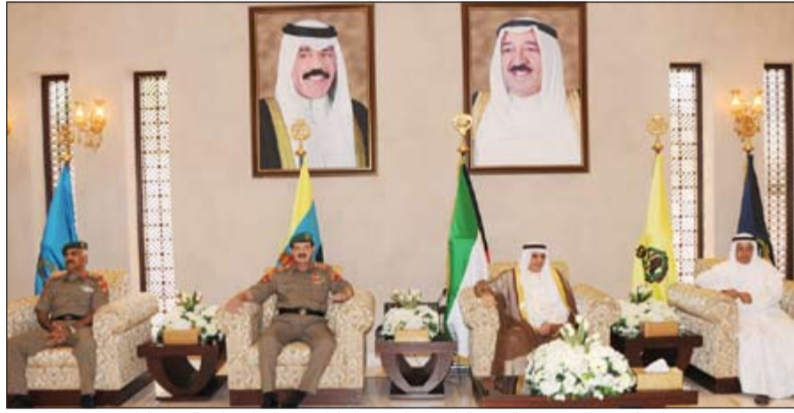
الشيخ خالد الجراح خلال الاستقبال بحضور الفريق الركن عبدالرحمن العثمان وجسار الجسار والفريق الركن محمد الخضر

ولي العهد وسمو رئيس مجلس الوزراء ووزير الدفاع الشيخ خالد الجراح، المهنيين من منتسبي وزارة الدفاع من عسكريين ومدنيين بمناسبة حلول شهر رمضان المبارك، وذلك بقاعة الفريق الركن أحمد الخالد الحمد الصباح بوزارة الدفاع. وتمنى بيهذه المناسبة أن يعيد الله عز وجل هذا الشهر المبارك على الكويت وشعبها بالأمن والأمان تحت ظل قيادة صاحب السمو الأمير القائد الأعلى للقوات المسلحة الشيخ صباح الأحمد، وسمو