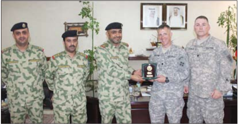
الوفد الأميركي خلال الزيارة