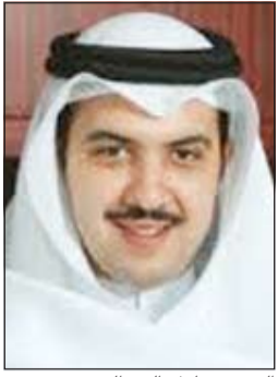
الشيخ مبارك عبدالله