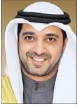
الشيخ محمد عبدالله

يستقبل أبناء المغفور له الشيخ عبدالله المبارك الصباح المهنيين بقدم شهر رمضان المبارك الأربعة وهو اليوم الرابع من الشهر الفضيل بعد صلاة العشاء في القصر الأبيض بمنطقة المسرة، كما يستقبلون رواد الديوانية مساء كل ثلاثاء بعد صلاة العشاء.