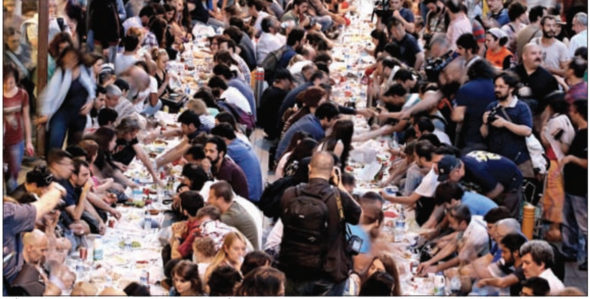
مئات الأتراك ينتظرون الإفطار في إحدى الموائد الجماعية في اسطنبول في أول أيام رمضان أمس الأول

نقرة - أ.ف.ب: يتوقع أن يعلن رئيس الوزراء التركي رجب طيب أردوغان غداً ترشحه للانتخابات الرئاسية في 10 و24 أغسطس والتي إذا فاز بها كما هو مرجح، ستكون استمراراً لحكمه لتركيا منذ أكثر من عقد.