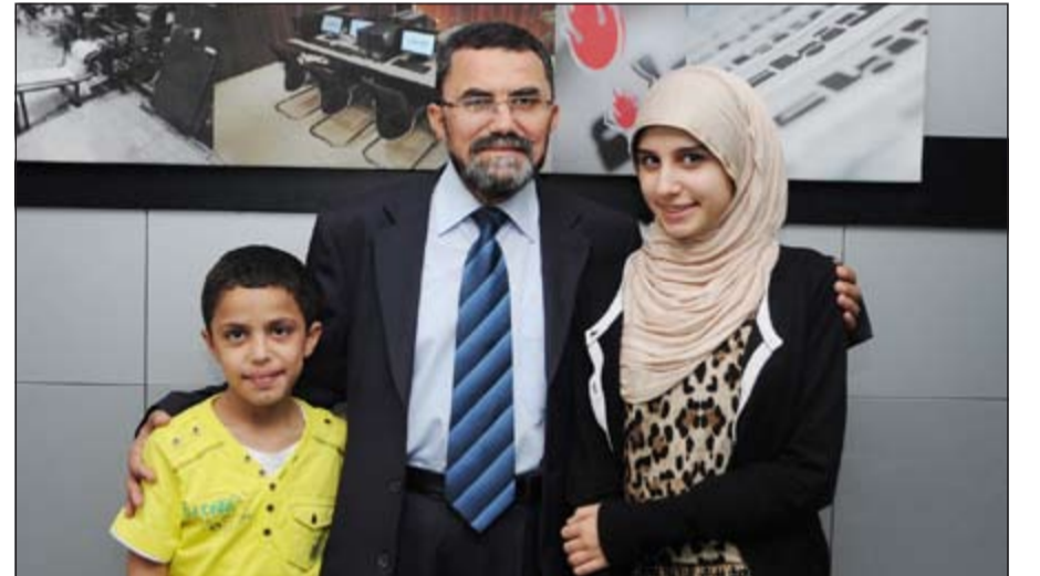
آية مع والدها وأخيها

نصيحة للطلاب وهي الثقة بالله تعالى والحرص على بر الوالدين والمدرسين والالتزام بالقواعد المدرسية والحفاظ على الوقت وتنظيمه وممارسة العديد من الهوايات للترفيه والدراسة وعدم تأجيل عمل اليوم إلى الغد أو التقصير في العمل والبعد أشد البعد عن الكسل والاستهتار والتخلي بمكارم الأخلاق وتقوى الله والثقة بالنفس التي تساعد دائماً على التقدم والنجاح.