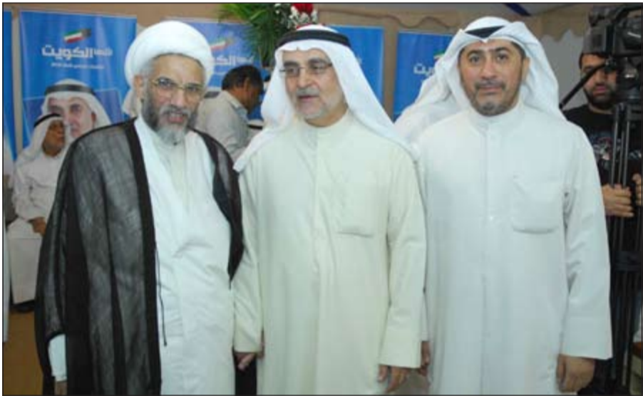
هاني شمس وأحمد لاري يتلقيان تهنئة بالفوز

أعرب النائب أحمد لاري عن اعتزازه وشكره لأبناء الدائرة الثانية بعد إعلان فوزه بعضوية مجلس الأمة، مؤكداً استمراره في العمل لخدمة الكويت، كما عهده الجميع في المجالس السابقة. وأكد لاري أن ثقة أبناء الدائرة ستكون دعماً كبيراً له في العمل لتحقيق المزيد من الإنجازات لمواجهة القصور الذي تشهده جميع المجالات في الكويت، مشيراً إلى أهمية العمل الجماعي والتعاون بين جميع الأطراف لتحقيق التنمية بعيداً عن الاتهامات المتبادلة.