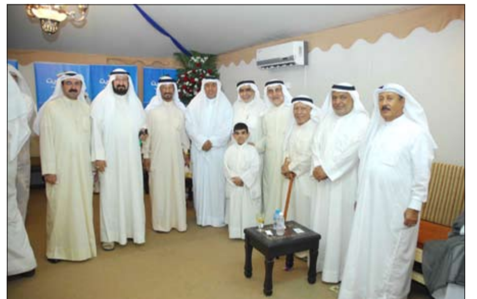
جانب من المباركين