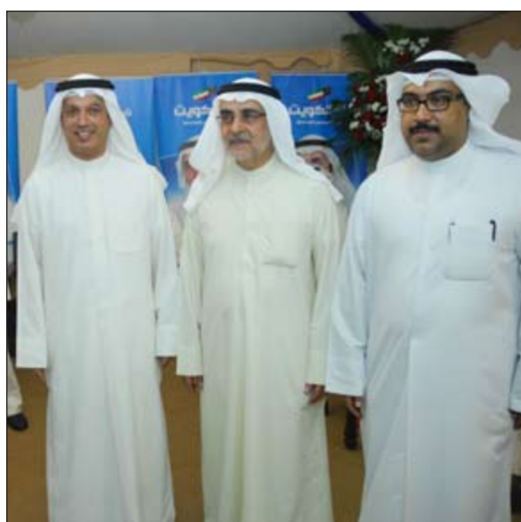
لاري وبعض المهنيين