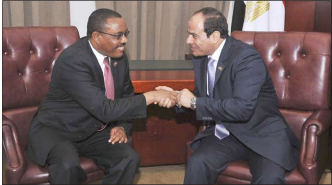
الرئيس المصري عبد الفتاح السيسي يلتقي رئيس الوزراء الإثيوبي هيلي ماريام ديسالين على هامش القمة الإفريقية في غينيا امس الأول

الأناضول: أعربت إثيوبيا امس عن التزامها بتجنب أي ضرر محتمل من سد النهضة على استخدامات مصر من المياه.