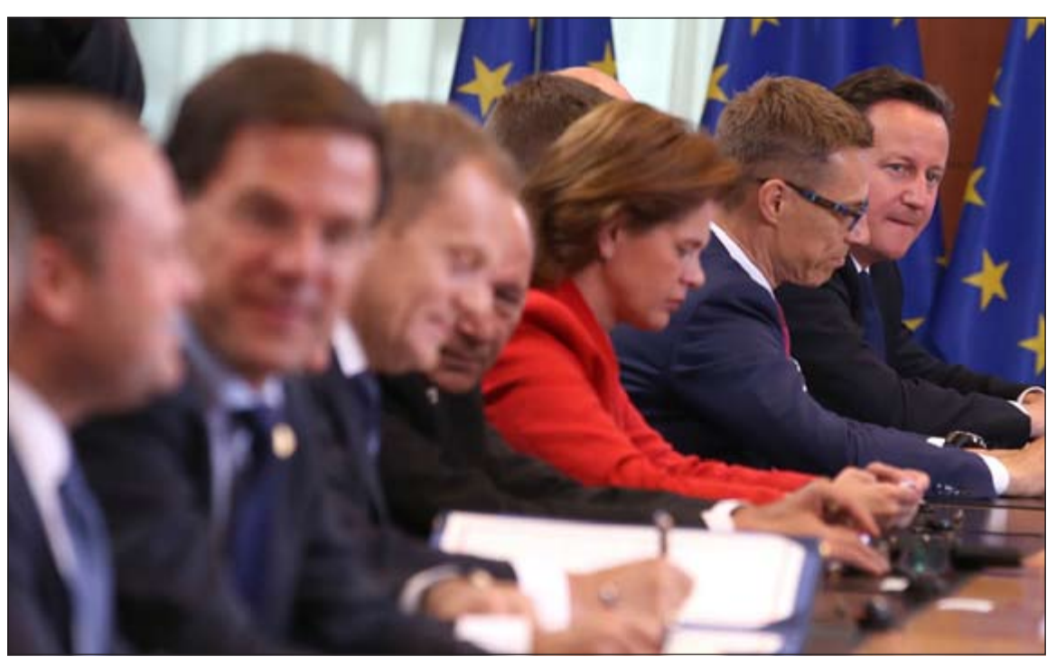
جانب من توقيع اتفاق الشراكة امس

بروكسل - أ.ف.ب: وقعت أوكرانيا في بروكسل اتفاق شراكة تاريخيا امس مع الاتحاد الأوروبي يبعدها عن تأثير روسيا التي حذرت من «عواقب خطيرة» ستترتب على الاتفاق. وكان امتناع أوكرانيا عن توقيع الاتفاق في نوفمبر الماضي وراء الحركة الاحتجاجية التي أدت إلى الإطاحة بالرئيس الموالي لروسيا فيكتور تيموشنكو. وصرح بوروشنكو «أنه يوم عظيم بالنسبة لبلاده بل ربما الأهم منذ الاستقلال»، وقال أنه «لا مفر من التطور في التاريخ»، مشددا على أن الاتفاق يشمل «أوكرانيا كلها بما فيها القرم». وصرح هرمان فان رومبوي رئيس مجلس أوروبا «أنه يوم عظيم لأوروبا.. الاتحاد الأوروبي يقف إلى جانبكم اليوم أكثر من أي وقت مضى». ووقع الاتحاد الأوروبي امس اتفاق الشراكة مع أوكرانيا وجورجيا ومولدافيا الجمهوريات السوفييتية السابقة الثلاث التي تسعى إلى التقرب من أوروبا الغربية رغم ضغوط موسكو. على الاتفاق في بروكسل بين رؤساء دول وحكومات البلدان الـ 28 في الاتحاد الأوروبي وكل من الرئيس الأوكراني بترو بوروشنكو ورئيسي حكومتي جورجيا ايراكلي غاريباشفيلي ومولدافيا يوري ليانكا. من جهة أخرى، وبينما كلف الغربيون ضغوطهم على روسيا لتبدي فعليا نيتها بحل الأزمة التي تهدد وحدة أوكرانيا، اطلق خلال ليل امس الأول سراح أربعة مراقبين من منظمة الامن والتعاون في أوروبا