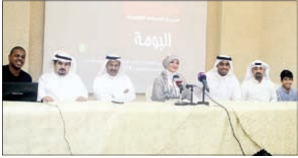
جانب من المؤتمر الصحافي