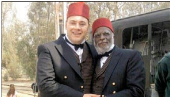
محمد رزق في أحد أعماله الرمضانية

يشارك الممثل الشاب محمد علي رزق في سباق رمضان الدرامي بعدة شخصيات متنوعة تتميز بالاختلاف الشديد فيما بينها، حيث يظهر في شخصيات عازف الأوبرا، والحرامي، والشماشرجي، بالإضافة إلى مشاركته لنجوم كبار مثل عادل إمام ومحمود عبدالعزيز. في مسلسل «جيل الحلال»، يقوم بدور «عطية»، الشاب الصعيدي، الذي تربطه علاقة قرابة بالفنان محمود عبدالعزيز. فهو ابن أخيه، وزوج ابنته في الوقت نفسه، المسلسل من إخراج عادل أديب، وتأليف ناصر عبدالرحمن، ويمشارك في البطولة وفاء عامر، خالد سليم، طارق لطفي، نرمين الفقي، مي سليم، وعدد آخر من النجوم.