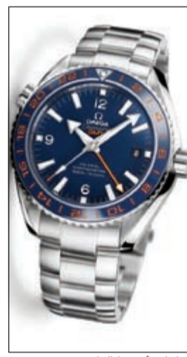
ساعات أوميغا الفاخرة

كيكي على تثقيف وتعليم السكان المحليين، بما في ذلك جيل الشباب، الطرق المختلفة للمحافظة على الموارد الطبيعية. خسرت الجزيرة خلال فترة ازدهار تربية الأحياء المائية منذ عام 1990 أكثر من 70٪ من أشجار المنغروف، وقد أثر ذلك بشكل كبير على المنطقة حيث حد من التنوع البيولوجي وسبب اختلالا في النظام البيئي، ومن هذا المنطلق ستعمل أوميغا بالتعاون مع منظمة غود بلانيت على تطبيق واستخدام طرق منهجية تعيد النظام البيئي إلى سابق عهده وتوجه المجتمع المحلي إلى استخدام بدائل فعالة ونظم أكثر استدامة في الجزيرة وعلى سواحلها.