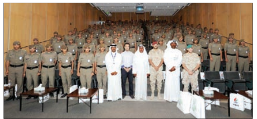
فريق «البتترول الوطنية» يتوسط الطلبة الضباط