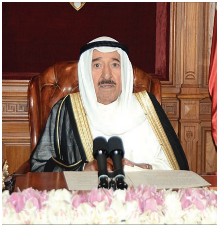
صاحب السمو الأمير الشيخ صباح الأحمد يلقي كلمة إلى المواطنين

وجه صاحب السمو الأمير الشيخ صباح الأحمد كلمة لأخواته وأبنائه المواطنين الكرام هذا نصها..