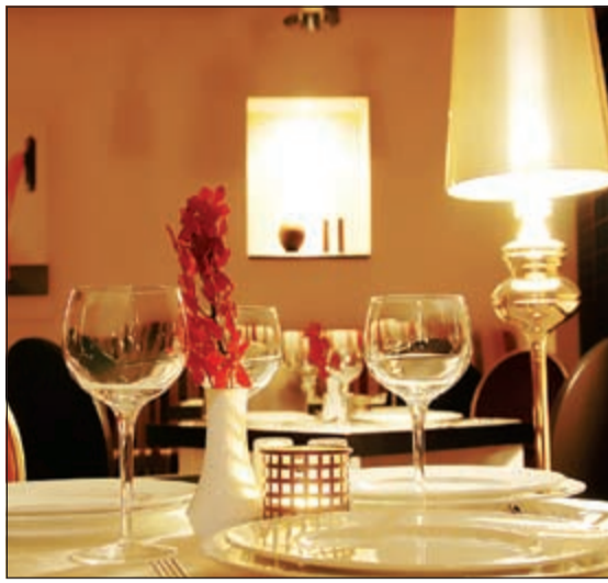
أجواء رمضانية مميزة

وتسعى إيكيا الكويت إلى الاحتفال بشهر رمضان المبارك مع عملائها عن طريق تقديم مجموعة مختلفة من الأثاث، تجهيزات المطبخ، أدوات الطعام وبأسعار منخفضة ومميزة. كما ستقوم إيكيا باستضافة خيمة رمضان احتفالية، وتقديم القهوة والمشروبات التقليدية لجميع الزوار، مجاناً، خلال تسوقهم بعد الإفطار. وسيكون معرض إيكيا مفتوحاً من 10:00 صباحاً حتى 3:30 مساءً، ومن 8 مساءً حتى 1 ليلاً، لاستيعاب المتسوقين وضمان راحتهم. أما مطعم إيكيا فسيقدم أيضاً وجبة إفطار يومية خاصة بسعر مبدئي - 1,950 د.ك، وتتضمن الوجبة طبقاً مميزاً كل يوم في شهر رمضان الفضيل، بالإضافة إلى شوربة العدس ولبن والحلويات العربية والتمر. قائمة الطعام الصحية