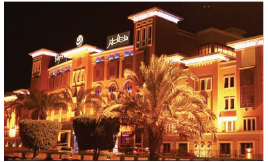
فندق سفير الفنتاس