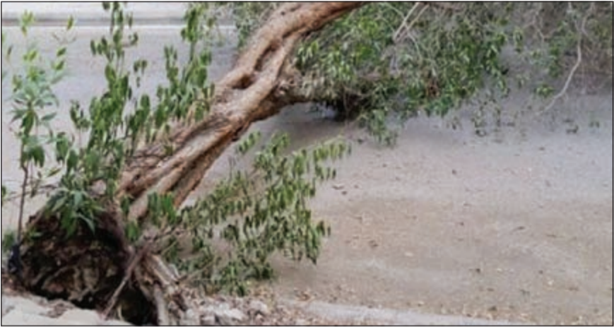
الشجرة اقتلعت من جذورها