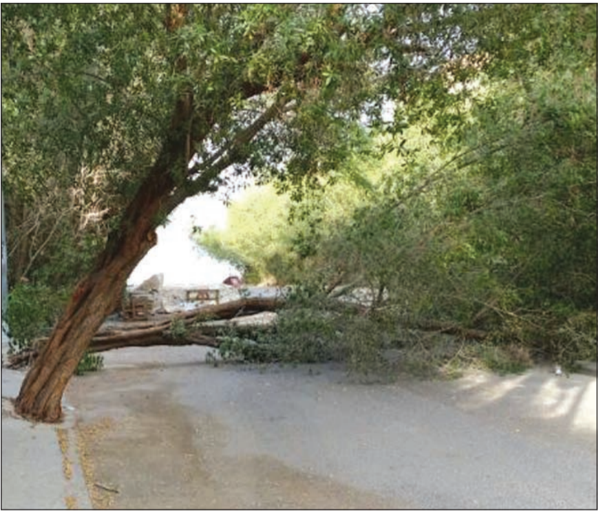
الشجرة بعد سقوطها تغلق الطريق