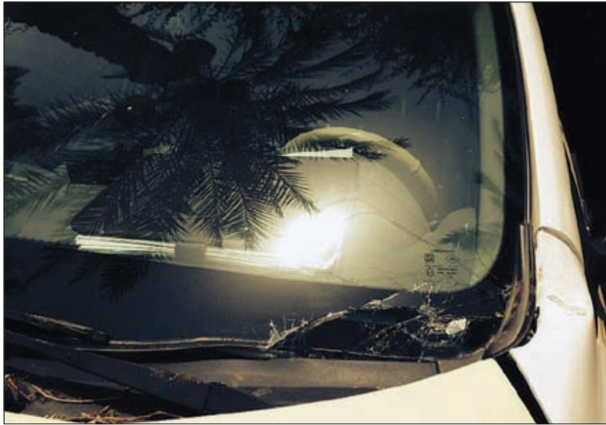
إجاعة السيارة، وقد كسرت بفعل السقوط