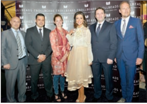
اداريو الشركة خلال الحفل