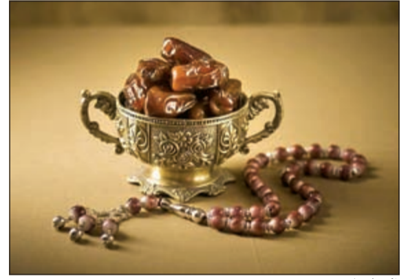
ذكريات لا تنسى

العالمية، إضافة إلى محطات الطبخ والكهجات المختلفة من الشيشة (الأركيلة)، كما تنتظر الضيوف خصوصاً عالية في الفندق عن طريق شراء القسائم المدفوعة مسبقاً لحجوزات المجموعات للاستمتاع بالإفطار والسحور خلال شهر رمضان المبارك. وفي أثناء السحور، يمكن للضيوف الاستمتاع بالجو العائلي المريح وتجربة الراحة في الخيمة الرمضانية الخاصة مع المشروبات الرمضانية المجانية، بينما يستمتعون بالفقرة الموسيقية