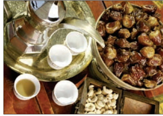
ليالي رمضان ساحرة

لأن كل امرأة فريدة ومتألئة بأسلوبها وطريقة حياتها، سعت شركة أولد دايموند لتوفير عالم جديد ومتميز من المجوهرات التي تتناسب مع الأسلوب والشخصية المنفردة لكل سيدة. وتطبيقاً لذلك قامت الشركة مؤخراً بافتتاح معرضها الجديد ترول بيدز في مركز التسوق الجديد والكائن في العقيلة ذا جيت مول. حضر حفل الافتتاح ضيفاً الشرف الفنانة ميساء مغربي وممثلون عن إدارة شركة أولد دايموند، ومن شركة ترول بيدز، الذين تواجدوا خصوصاً من الدنمرك للمشاركة في هذا الحدث الاستثنائي، ولغيف من كبار المدعوين وممثلي الصحافة ووسائل الإعلام. من الدنمرك، قدمت ترول لمنطقة الخليج العربي، لتنتشر مفهوم «مجوهرات الخرز والأحجار الكريمة» ولتوفر للسيدات والفتيات من مختلف الأعمار اختيارات متعددة ومتألئة من الأكسسوارات المصممة باليد من قبل أكثر من 60 فناناً مستخدمين أرفع