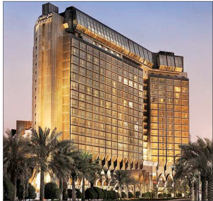
فندق جي دبليو ماريوت الانيق

ليالي ألف ليلة وليلة تعود في كورت يارد ماريوت، إذ سيتحول مطعم «أتريوم» ذو الأدوار الثمانية إلى خيمة رمضان بانورامية جميلة، تقدم به البوفيهات الشرقية والعالمية الرائعة كل ليلة لتناول إفطار وسحور شهيين، إلى جانب البوفيه التقليدي الذي يرمز إلى تراث الضيافة الكويتية، وستكون هناك أيضاً، محطات طهي حبة مثيرة تتضمن الكشري، الشاورما، الصاج، أوزي الأرز، الفواكه المجففة، القطايف، وأكثر من ذلك. إضافة إلى المحطة المغربية الخاصة، وركن البرغر وزاوية الأيس كريم، للاستمتاع بالآجواء الرمضانية الرائعة، يمكن للضيوف استكشاف نُكهات مختلفة من الشيشة خلال الاستماع إلى مجموعة من الموسيقى العربية.