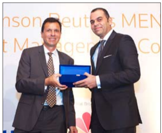
ممثل البنك الوطني - مصر يتسلم الجائزة

بأن الشركة ستضم هاتين الجائزتين إلى مجموعة الجوائز والأوسمة المماثلة التي حصدها الشركة مؤخرا والتي تعكس معايير التميز التي تسعى الشركة دائما إلى تحقيقها، هذا وتدبر الشركة في الوقت الحالي أربعة صناديق استثمار في مصر هي صندوق السيولة النقدية، وصندوق الدخل الثابت، والصندوق المتوازن، وصندوق الأسهم الذي يعمل وفقا للشريعة الإسلامية، بالإضافة إلى مجموعة محافظ مدارة بشكل مستقل.