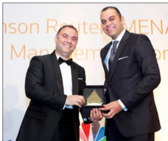
.. ويتسلم الجائزة الثانية