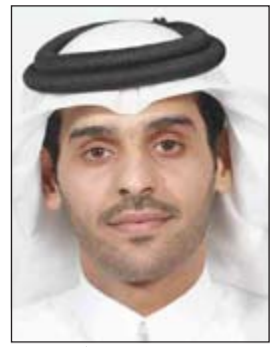
الشيخ محمد بن عبد الله آل ثاني

فخرو على المساهمة القيمة التي قدمها أثناء توليه منصب الرئيس التنفيذي لـ Ooredoo الكويت والتي تميزت بروح المثابرة والأصرار والعمل الجاد الذي بذله خلال تلك الفترة، وتطلع للاستفادة من خدماته وخبراته في المجموعة وفي مجلس الإدارة كعضو في مجلس إدارة Ooredoo الكويت، كما تنتمي التوفيق للشيخ محمد بن عبد الله آل ثاني في قيادة الشركة في هذه المرحلة والتي تشهد تطورات كثيرة على رأسها إطلاق