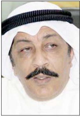
اللواء عبدالحميد العوضي

العوضي عن استغلال شقة في محافظة حولي لطباعة ونسخ الأفلام المحظورة والتي منها المسيئة وأخرى إباحية وعليه تم إصدار التعليمات إلى مدير مباحث الآداب والذي بدوره أجرى تحريات وأسفرت هذه التحريات عن استغلال الشقة في أعمال مخالفة وانتهاك الحقوق الفكرية، وعليه تم استصدار إذن نيابي ومداومة الوكر وضبط الأفلام ومعدات النسخ.