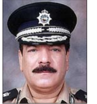
اللواء عبدالفتاح العلي