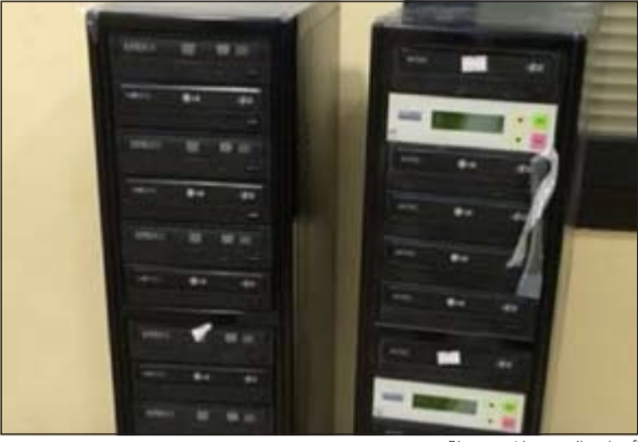
أدوات النسخ المضبوطة