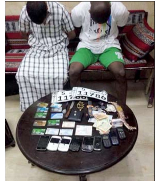
اللسان وأسامها المضبوطات