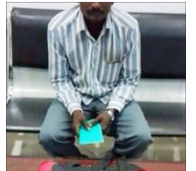
الهيروين المضبوط بعد اخراجه من شنطة السفر

أوقف رجال جمارك المطار وافدا من الجنسية الهندية ويجوزته كيلو من مادة الهيروين التي تعثر بها وتم تسجيل قضية. وفي التفاصيل التي يرويها مصدر أمني أن فريق الجواله الجمركي اشتبهوا في مسافر على الرحلة القادمة في مسافر الشارقة وتم استيقافه من قبل الجمركيين وإحالته إلى غرفة التفتيش بعد أن ظهرت عليه علامات الارتباك فتم اكتشاف سبب الارتباك بعد وجود كيلو من الهيروين في أرضية حقيبة اليد وتم إحالة المتهم إلى جهة الاختصاص.