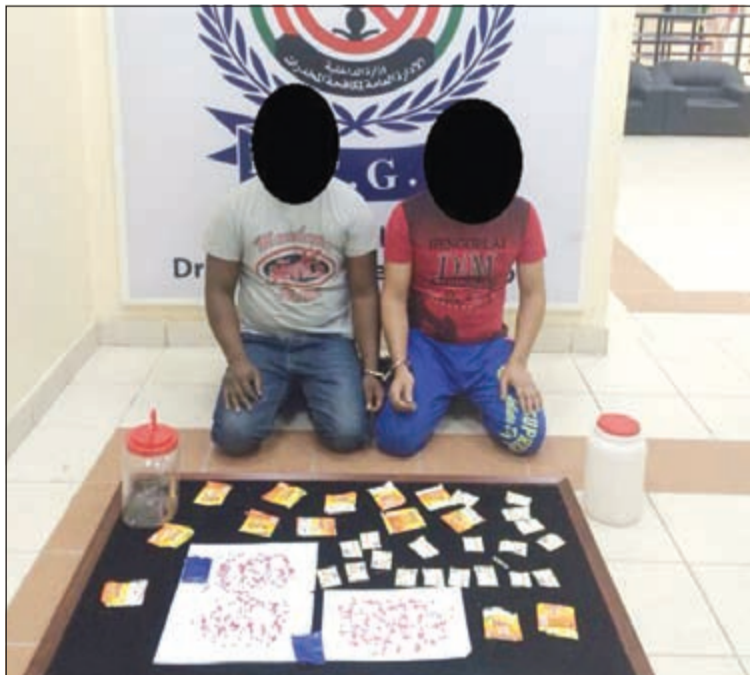
المتهمان وأمامهما كمية المخدرات المضبوطة

تم تكثيف التحريات التي أسفرت عن معرفة بيانات المتهم بالكامل. وتم استصدار إذن قانوني من النيابة العامة لضبطه، وبمداهمة مسكنه ضبطت كمية من حبوب الترامادول بحوزته، وبالتحقيق معه اعترف بان لديه شريكاً في الاتجار بالمؤثرات العقلية وأبدي تعاوناً للإرشاد عنه، وتم الانتقال إلى مسكن شريكه وجرى ضبطه وعثر بحوزته على باقي الكمية، وبالتحقيق معه اعترف بأنه شريكه منذ فترة. هذا، وتم إحالتهما والمضبوطات إلى جهات الاختصاص لاتخاذ الإجراءات القانونية.