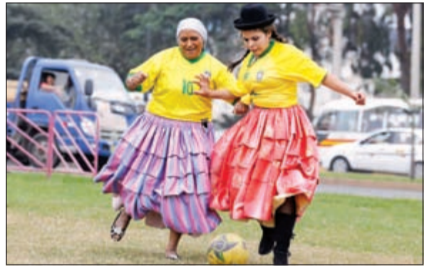
امرأتان من بيرو تتركان الكرة بالقرب من مجمع لاسولينا في ليمبا

فيما كاد المهاجم الفرنسي كريم بنزيمة يحقق العلامة الكاملة لولا اهداره ركلة جزاء فرنسية الأولى في المونديال، إذ سجل هدفاً وصنع عدة فرص حاسمة أمام المرعى السويسري. وكانت العاصمة السابقة للدولة إحدى أولى المناطق التي استوطنها الأوروبيون في الأمريكتين، وهي مميزة في البرازيل بسبب ثقافتها وأطباقها المحلية كما أنها أغنى مدينة في شمال شرق البرازيل، وبالفعل أقيمت المباريات الثلاث الأولى على ملعبها بين طرفين أوروبيين (اسبانيا- هولندا، ألمانيا - البرتغال، سويسرا - فرنسا). وامتدت حمى المونديال إلى الفلبين وابتكرت فنون الهوس الكروي بغطاس في حوض مائي بزي السامبا يستعرض أمام الجمهور، فيما كتبت ليمبا عاصمة بيرو على موعد مع استعراض الفلكلور للسيدات وهن يرتكن الكرة.