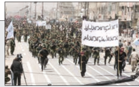
متطوعون من سرايا السلام التابعة للصدر يستعرضون جاهزيتهم للحرب