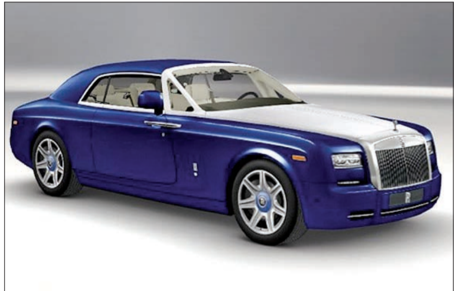
الصورة الفائزة في الأسبوع الثالث لمسابقة أفضل تصميم لروزلر رويس

أطلق هذه المسابقة مواكبة لحملة الصيفية السنوية لمكافأة عملائه بفرصة الدخول في سحب للفوز بسيارة رولز رويس فانطوم لأول مرة في الكويت والسفر إلى المملكة المتحدة لزيارة مصنع شركة رولز رويس وتصميمها حسب طلبهم. وتتابع صفحة البنك الوطني على إنستغرام تفاصيل الحملة الصيفية استجابة للتفاعل الكبير من قبل المتابعين تجاه الجائزة الكبرى المقدمة هذا العام. وينفرد البنك الوطني بتغطية مختلف مواقع التواصل الاجتماعي في الكويت من فيسبوك وتويتر وإنستغرام ويوتيوب وفورسكوير وغوغل بلاس. ويحرص البنك الوطني دوما على مواكبة تطلعات الشباب والتفاعل معهم من خلال العروض والخدمات ومكافأته بطاقة هدية مسبقة الدفع من البنك الوطني بقيمة 100 دينار. وتجدر الإشارة إلى أن البنك الوطني