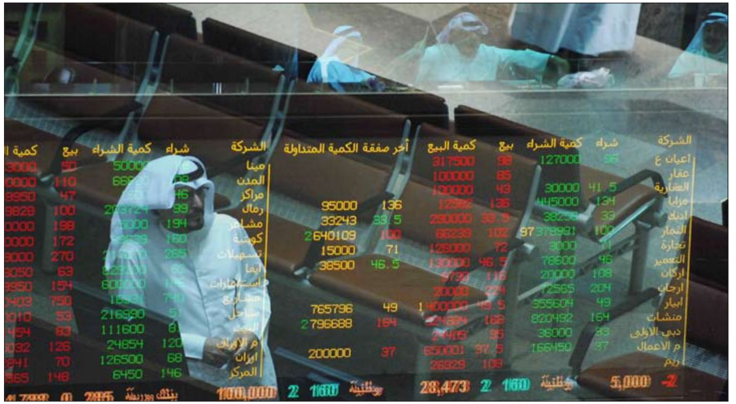
بورصة الكويت تشهد تراجعا كبيرا خلال الايام الماضية بسبب التوترات الامنية في العراق

وأضاف: «يلقى فريق البنك لكرة القدم كل الاهتمام إلى جانب بقية الفرق المشاركة في بطولات اتحاد مصارف الكويت كالبولينغ والكريكت، حيث تمكنت هذه الفرق من تحقيق عدة بطولات خلال الفترة الأخيرة نتيجة للاهتمام الذي تحظى به ومناخ شباب البنك». يذكر أن فريق البنك لكرة القدم حصل على البطولة بعد تغلبه على بيت التمويل الكويتي في المباراة النهائية 0-1 التي جرت على ملعب الصداقة والسلام بنادي كاتظمة بحضور عدد كبير من مسؤولي اتحاد مصارف الكويت إلى جانب مسؤولي بنك بوبيان وبيت التمويل الكويتي.