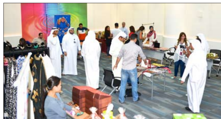
موظفو الشركة في المعرض

من المعروضات الرمضانية التي تقدم بشكل حصري لموظفي الشركة، موضحة أن المعرض شهد إقبالا كبيرا من موظفيها أثناء فترة تنظيمه من خلال المشاركة الفعالة التي أبدتها الموظفون أثناء زيارتهم للمعرض. وأوضحت الشركة أنها وبتقديم الفرصة لموظفيها