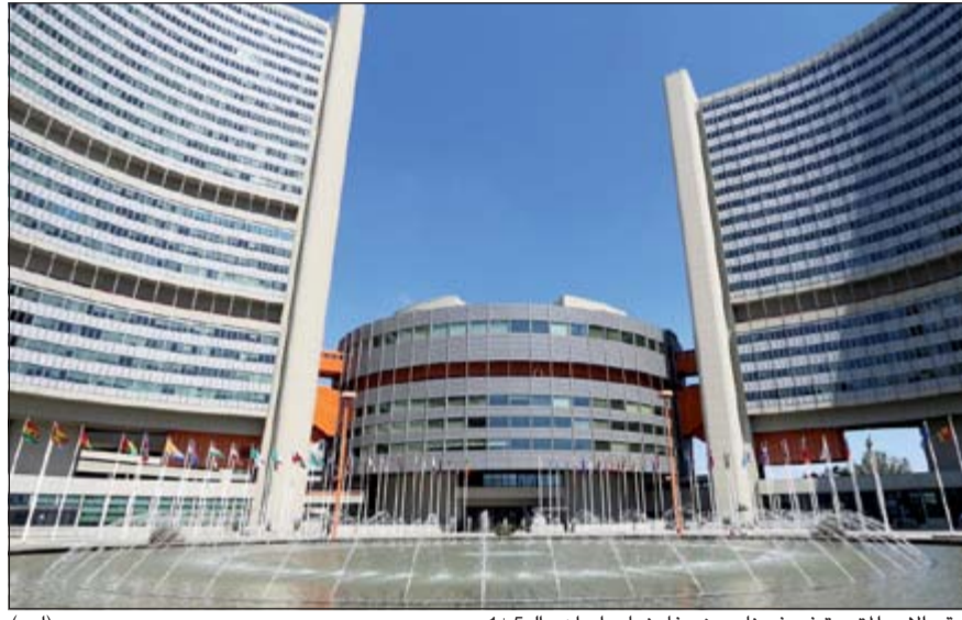
مقر الامم المتحدة في فيينا حيث مفاوضات ايران الـ 1+5 (ب ا)

«التبادل العميق» لوجهات النظر في اجواء وصفها بأنها بناءة، وذلك قبل شهر من الموعد المحدد للتوصل الى اتفاق. وقال المصدر الغربي ان «الخلافات كبيرة حول تخصيب اليورانيوم الذي يتيح بدرجات عالية الحصول على الوقود اللازم لصنع سلاح نووي، موضحة ان المباحثات لم تتطرق بعد الى عدد أجهزة الطرد المركزي التي تستخدم لتخصيب اليورانيوم والتي تريد إيران الاحتفاظ بها بعد التوصل الى اتفاق. وأضاف المصدر نفسه