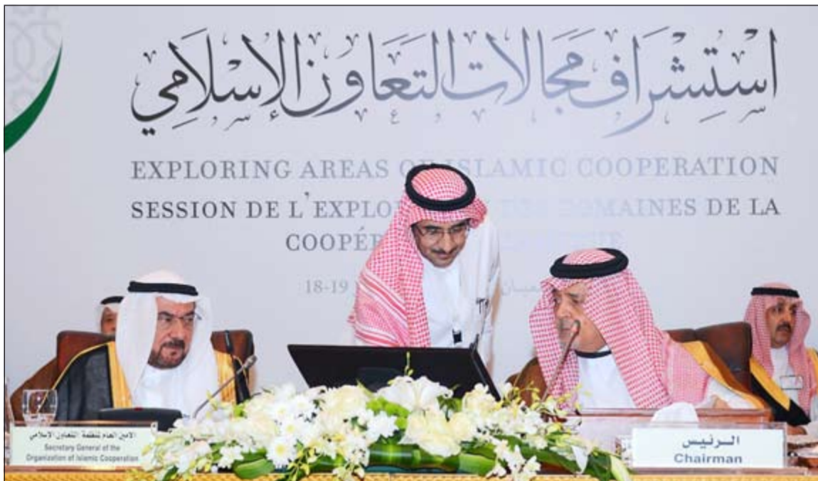
صاحب السمو الملكي الأمير سعود الفيصل وزير الخارجية السعودي مترئسا للجلسة الختامية لمؤتمر وزراء التعاون الإسلامي في جدة أمس

وكان مسلحون قد هاجموا المصفاة على مدى اليومين الماضيين، انسحبوا من مواقعهم أمس تحت «ضربات جوية» وبعدها تصدت القوات العراقية لهجماتهم.