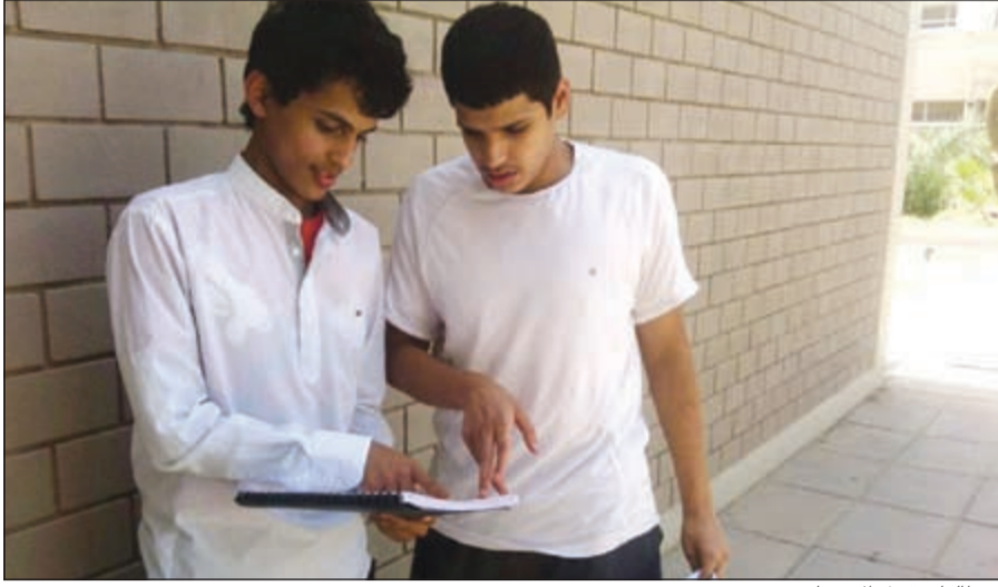
..وطالبان قبيل الاختبار

وعند مقابلة مجموعة من الطالبات لسؤالهن عن سير الاختبارات فقد اتفقت الطالبات على أن اختبار مادة الإسلامية كان سهلاً وكل ما جاء فيه كان واضحاً لا يحتاج إلى أي توضيح كما أنه يراعي جميع القدرات وأنه لا توجد صعوبات في المذاكرة إلا بكمية المنهج كانت كبيرة وقد تم التحضير للمادة قبل فترة من خلال الدراسة المسبقة والمكثفة قبل موعد الاختبار أما بالنسبة للأجواء في المدرسة فقد كانت مناسبة لتأدية الاختبارات.