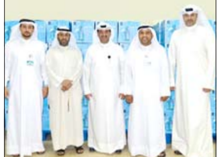
فريق زين مع ممثلي بيت الزكاة

أعلنت «زين» عن استعدادها لاستقبال شهر رمضان المبارك وذلك بتقديمها صناديق المواد الغذائية الأساسية (ماجلة) إلى بيت الزكاة لتأمين الحاجات الغذائية للأسر المتعففة في الكويت بمناسبة قدوم الشهر الكريم. وبيّنت الشركة في بيان صحفي أنها تقوم بهذه البادرة الخيرية السنوية انطلاقاً من برنامجه للمسؤولية الاجتماعية المكتف خلال الشهر الكريم، حيث حرصت على تأمين المؤونة الغذائية التي تتكون من المواد الأساسية، والتي عادة ما تكون الأيسر المتعففة في أمس الحاجة لها خلال شهر الصوم، وأوضحت زين أنها قدمت صناديق المواد الغذائية (الماجلة) لبيت الزكاة لتوزيعها على المحتاجين عن طريق بيت الزكاة، وذلك من أجل تقديم المعونة الغذائية الضرورية على الأسر المتعففة قبل قدوم شهر رمضان المبارك.