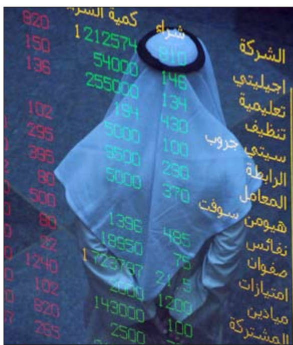
حال البورصة يدفع المتعاملين للخروج منها (ماني عبدالله)

ذكرت شركة التقدم التكنولوجي (التقدم) أنها وقعت عقداً مع وزارة الصحة بقيمة إجمالية 2,9 مليون دينار، مشيرة إلى أن العقد يتعلق بتجهيز توسعة مركز سلمان البدوس لجراحة وعناية القلب بالأجهزة وملحقاتها لحاجة مجلس أقسام الجراحة التخصصية (مستشفى العبدان) ومدة العقد سنة، وذكرت الشركة أن الأثر المتوقع على الوضع المالي للشركة هو تحقيق نسبة هامش ربح قدرها 8٪ من قيمة العقد وأن نسبة هامش الربح المذكورة هي نسبة تقديرية وغير ثابتة وتتغير صعوداً وهبوطاً.