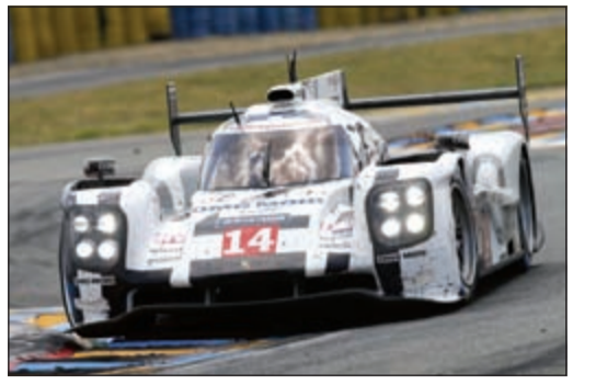
بورشه '911 آر إس آر' تتوج سباق 'لومان 24 ساعة'.. الأسطوري