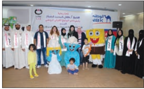
عدد من المشاركين في الاحتفال