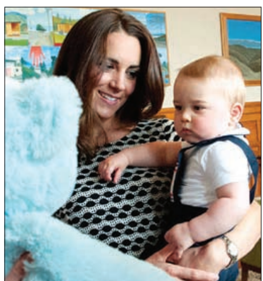
وينظر إلى بديوب ضخم

نشرت صحيفة ال«ديلي ميل» البريطانية مجموعة من الصور المميزة للأمير الرضيع جورج حفيد، ولي عهد بريطانيا الأمير تشارلز وابن الأمير وليام