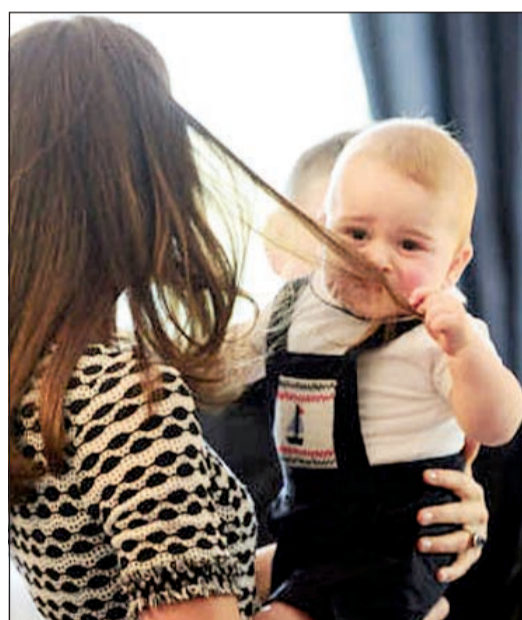
يشد أمه من شعرها

دوق كامبردج وقربنته الدوقة كيت، ويستمر نجم «الأمير الصغير» جورج السذي بالكاد بلغ شهره التاسع، في سريقة الأضواء منذ أن حملت به