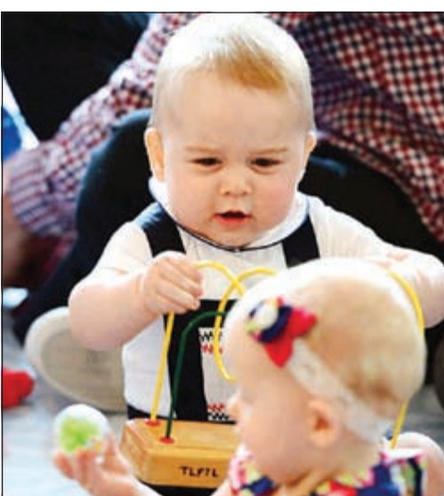
الأمير الصغير يداعب طفلة بجواره