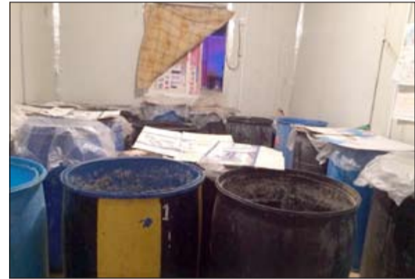
من مصنع الخمر

براميل بها خمر محلية، وعليه تم اخطار اللواء العلي السدي اعطى اوامره بتفتيش الحوطة، ومن ثم نفذ رجال الامن وتبين ان بداخلها 28 برميلا حجم كبير تحوي خمورا محلية وجهاز تقطير و4 اكياس وكمية من الطحين ومواد اخرى تستغل في تصنيع الخمر المحلي. من جهة اخرى اسفرت الحملات التفتيشية التي قامت بها مديرية أمن محافظة الأحمدى بمشاركة إدارة العمليات والدوريات التابعة لمديرية الأمن بالمحافظة عن ضبط 3 أشخاص بحوزتهم 213 قنينة خمر منهم 17 قنينة اجنبية، كما تم ضبط مواطن وبحوزته مخدرات وأدوات تعاط، بالإضافة إلى ضبط 63 شخصا مطلوبين على ذمة قضايا و12 آخرين لعدم حمل إثبات شخصية ومخالفة قانون الإقامة، كما تم تحرير 24 مخالفة مرورية.