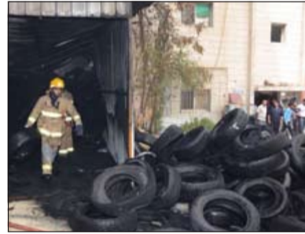
الحريق كشف عن مخلفات بالجملة