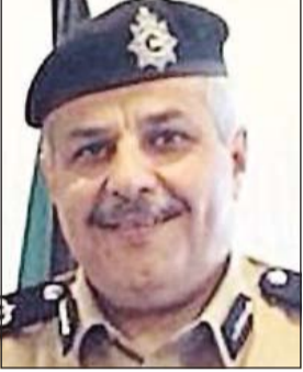
اللواء الشيخ مازن الجراح

واستطرد المصدر بالقول: بعد يومين من مخاطبة ادارة الجنسية للهيئة العامة