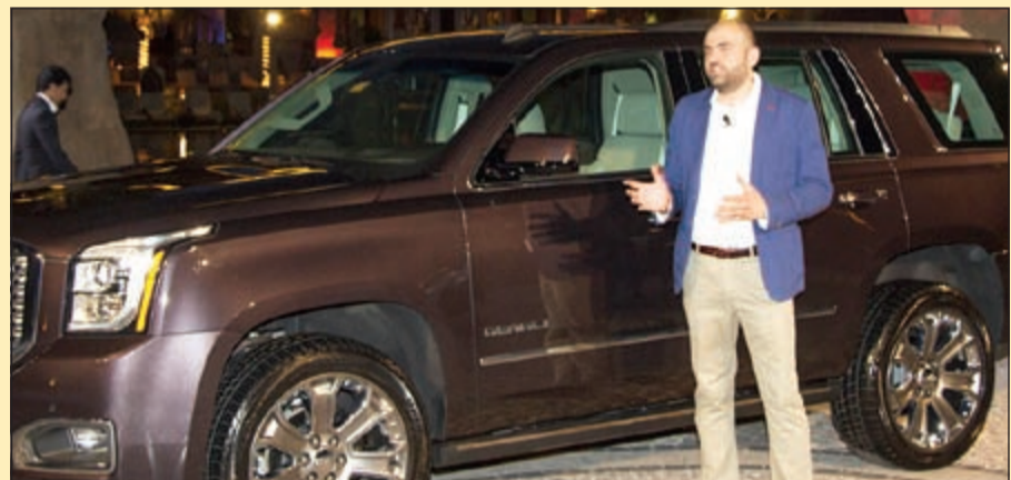
تديم غريب متحدثاً للصحافيين أثناء اطلاق يوكون