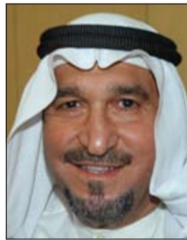
عبد اللطيف باقر

وقال باقر في تصريح صحافي إن هذه المحاولات «تتناهى مع أخلاقيات المجتمع الكويتي المتكاتف»، مشيراً إلى أن الدستور الكويتي كفل حق المواطن في اختيار من يراه مناسباً لتمثيله في البرلمان بكل سرية وبراءة كاملة.