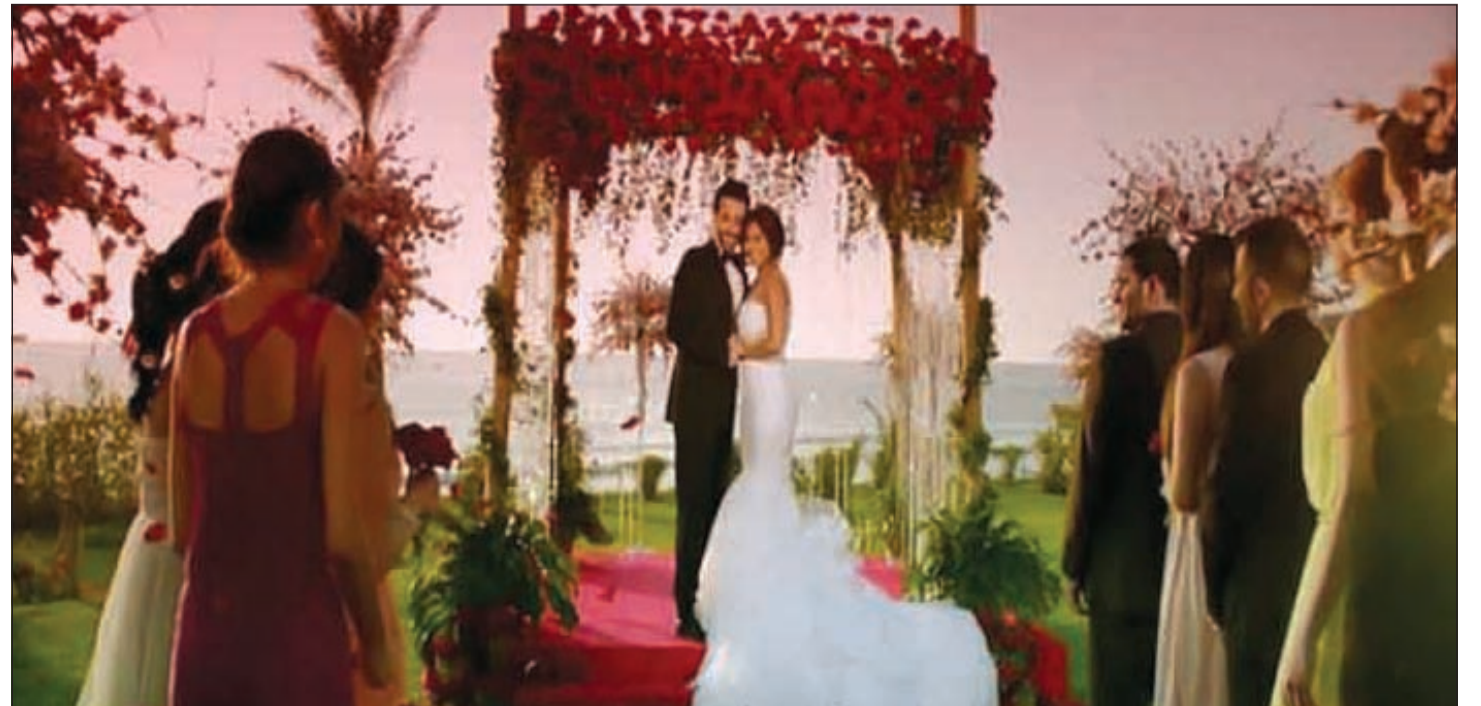
شيرين في كليب «كلي ملك»

الفتيات، ورسخت تصوير الأغنية في أذهان جمهورها، ما جعلهم يتداولونها بينهم على مواقع التواصل محققة نسبة كبيرة من المشاهدة على موقع اليوتيوب وصل لربع مليون مشاهدة في اليوم الأول لبداية عرضها،