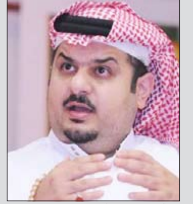
عبدالرحمن بن مساعد

قصيدة ونص شعري رائع كتبه المبدع عبدالرحمن بن مساعد الذي يلعب بشبيه الريح وله العديد من الأمسيات الشعرية أولها أقيمت في مملكة البحرين عام 1995 يمتلك الشاعر رصيدا من النصوص الجميلة التي تغني بها كبار الفنانين أمثال عبادي الجوهر ومحمد عبده وغيرهم الكثير. بن مساعد دائما ما يكتب قصيدة الحكمة التي تتمثل بمواقف تحكي هموم الناس بقالب شعري ساخر وهادف ميزته عن غيره من الشعراء، أما قصيدة البرواز فغزة فقنن من أشهر النصوص الغنائية التي نشد بها فنان العرب محمد عبده.