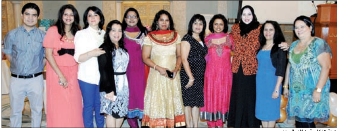
لقطة تذكارية خلال الحفل