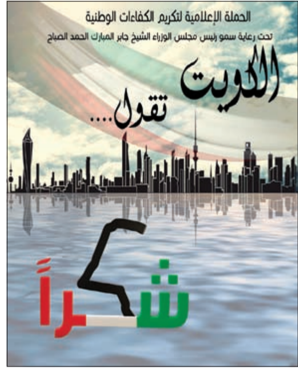
شعار حملة «الكويت تقول شكراً»