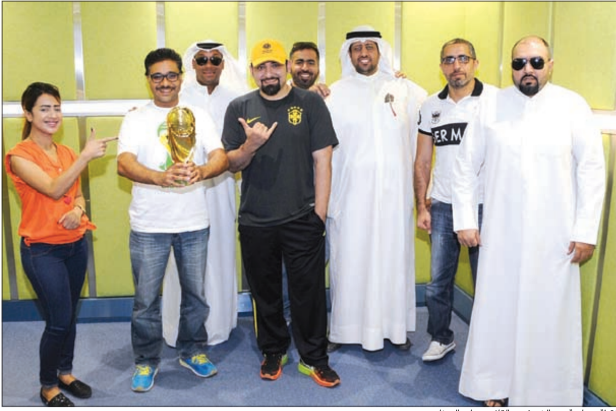
لقطة جماعية بين الضيفين والقائمين على البرنامج