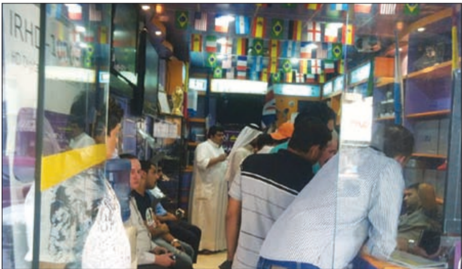
مجموعة كبيرة من الزبائن من أحد المحلات

حظوظ المنتخبين أو اللاعبين النجوم المشاركين، إلا أن هذه الآراء اتسمت بالروح الرياضية ولم تخرج عن المألوف. زيدان مو لاعب وتفاعل بعض الجماهير ومتابعو «القايلة الرياضية»