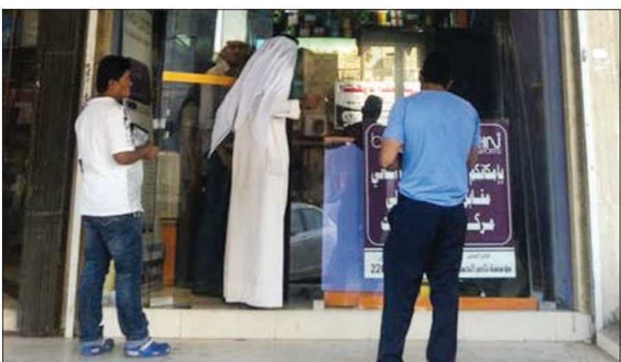
طلبات متزايدة شهدت محلات الستلايت

شهد اليومان الماضيان الازدحام والخميس ازدحاما غير مسبوق على محلات الستلايت للحصول على اشتراكات بطولة كأس العالم، وذلك للتمتع بمشاهدة المونديال طوال 31 يوما. ولم يمنع ارتفاع أسعار الاشتراك من توافد المواطنين والوافدين على المحلات، وهو ما جعل أصحابها يواجهون الليل بالنهار لتلبية متطلبات جميع الراغبين في الحصول على الـ HD والـ beIN sports الناقل الحصري للمنافسات في منطقة الشرق الأوسط وشمال أفريقيا.