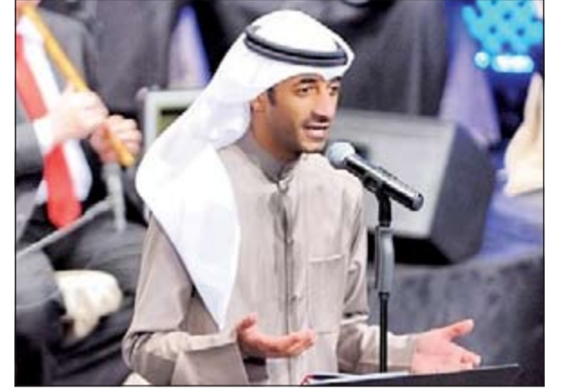
جاسم بن ثاني في المهرجان