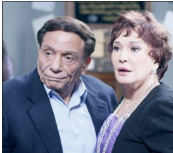
عادل إمام مع لبلبة في مشهد من المسلسل

بشكل بصمة ممتازة في مسيرتي المهنية.. قرر النجم الشاب ألا يفصح عن تفاصيل دوره في العمل، لكنه كشف جانباً من الأحداث الكفيلة بتشويق الجمهور، وبالتالي تمكينه من المتابعة، بعيداً عن «حرقها». ويشرح عن لقائه الأول على الطريق العام مع بهجت أبو الخير (عادل إمام)، الذي يساعده عند تعطل سيارته في الحلقة الثانية، ومنذ ذلك الحين، سيتردد عليه باستمرار، وينغص عليه حياته، حاملاً مواقف كوميدية متميزة.