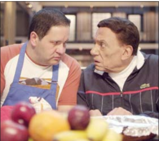
..ويعاد دوراد في مشهد كوميدي