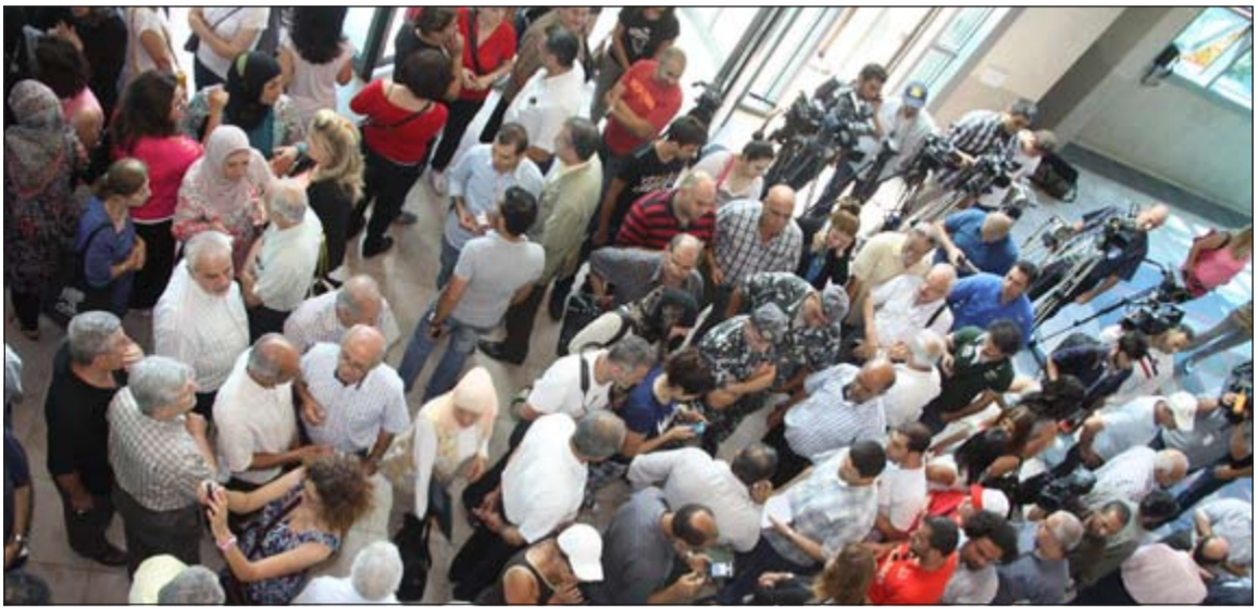
اعتصام مركزي لهيئة التنسيق النقابية امام وزارة التربية

وفي معلومات لـ «الأنباء» ان العماد ميشال عون حاول استمالة النائبة بهية الحريري، رئيس لجنة التربية النيابية للوقوف الى جانب اقرار السلسلة ومعهما كتلة المستقبل، عبر اتصال هاتفي لكن الرئيس فؤاد السنيورة وأعضاء الكتلة أجمعوا على رفض التشريع قبل انتخاب رئيس للجمهورية. ومع 14 آذار، تحفظت كتلة النائب وليد جنبلاط، وكذلك كتلة الرئيس نجيب ميقاتي، على خلفية الخوف من إسقاط البلد في الإفلاس، بموازاة تعطيل انتخاب رئيس للجمهورية. وقد جرت محاولات تسوية لإقرار مشروع معدل للسلسلة حتى ساعة متقدمة من الليل الماضي، إلا ان الانقسام السياسي طغى على هذه المحاولات.