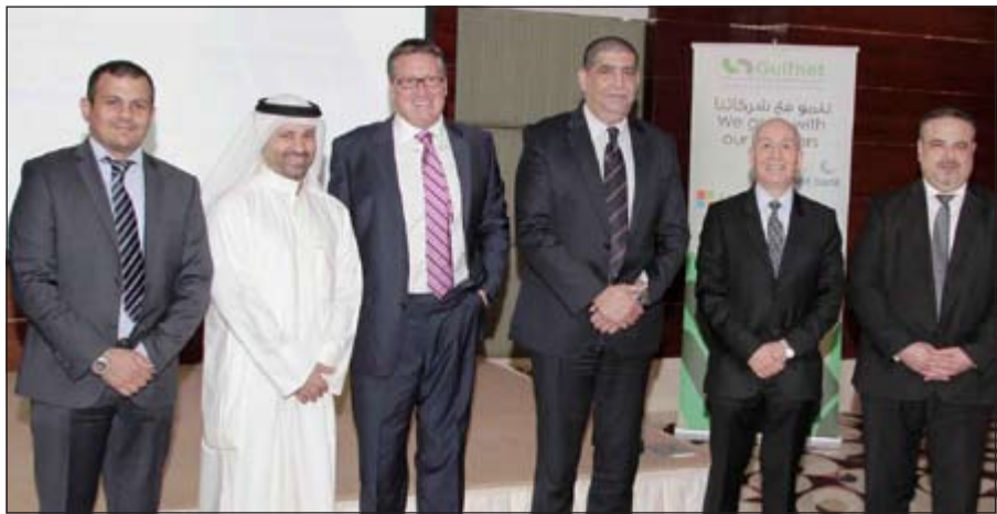
مسؤولون من «المتحد» و«مايكروسوفت» في الاحتفال بتدشين الحل الجديد