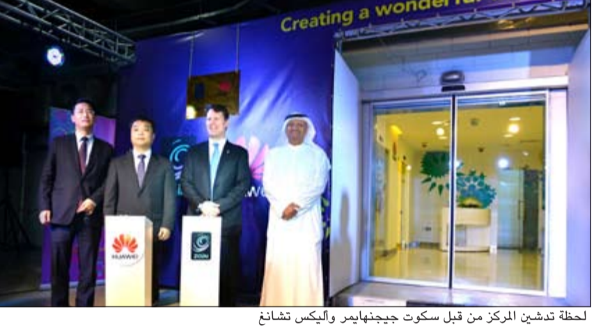
لحظة تدشين المركز من قبل سكوت جيجنهايمر وأليكس تشانغ

موعد آخر مع تجربة اتصالات غير مسبوقه تتميز بالسرعة والانسائية من خلال شبكتنا الأحدث».