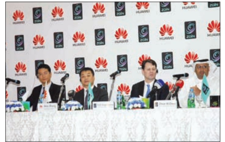
جانب من المؤتمر الصحافي