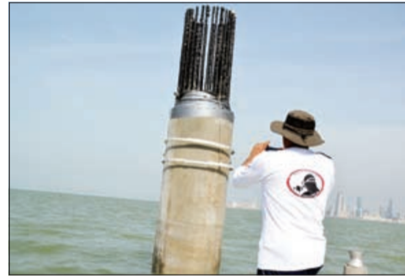
أحد أعضاء فريق الفوص امام أحد الأعمدة الخرسانية

حذر فريق الفوص بالمبرة التطوعية البيئية أصحاب القوارب والصيادين من الاقتراب من موقع مشروع جسر جابر والذي يمتد من ميناء الشويخ إلى رأس الصبية بطول 39 كيلو مترا وذلك لوجود أعمدة خرسانية مزروعة في شمال وجنوب ووسط جون الكويت، وأعلن الفريق ان الشركة المنفذة للمشروع وهي شركة هبونداي قامت مؤخرا بزراعة 3 أعمدة خرسانية كبيرة في جنوب جون الكويت في الموقع التالي: