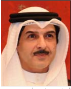
السفير يوسف عبدالصمد

سراييفو - كونا: تلقت السفارة الكويتية في بلغراد مذكرة شكر من الحكومة الصربية عبرت فيها عن تقديرها لتقديم الكويت منحة مالية قيمتها مليون دولار لمتضرري الفيضانات التي اجتاحت البلاد الشهر الماضي. وقال سفيرنا لدى جمهورية صربيا يوسف عبدالصمد في تصريح لـ «كونا» أمس أن السفارة تلقت أيضا ردود أفعال إيجابية من جميع الأوساط السياسية والاجتماعية على تقديم المساعدات لمخوكبي الفيضانات. وأوضح السفير عبدالصمد أن مجلس الوزراء كان قد اتخذ قرارا بتقديم منحة مالية