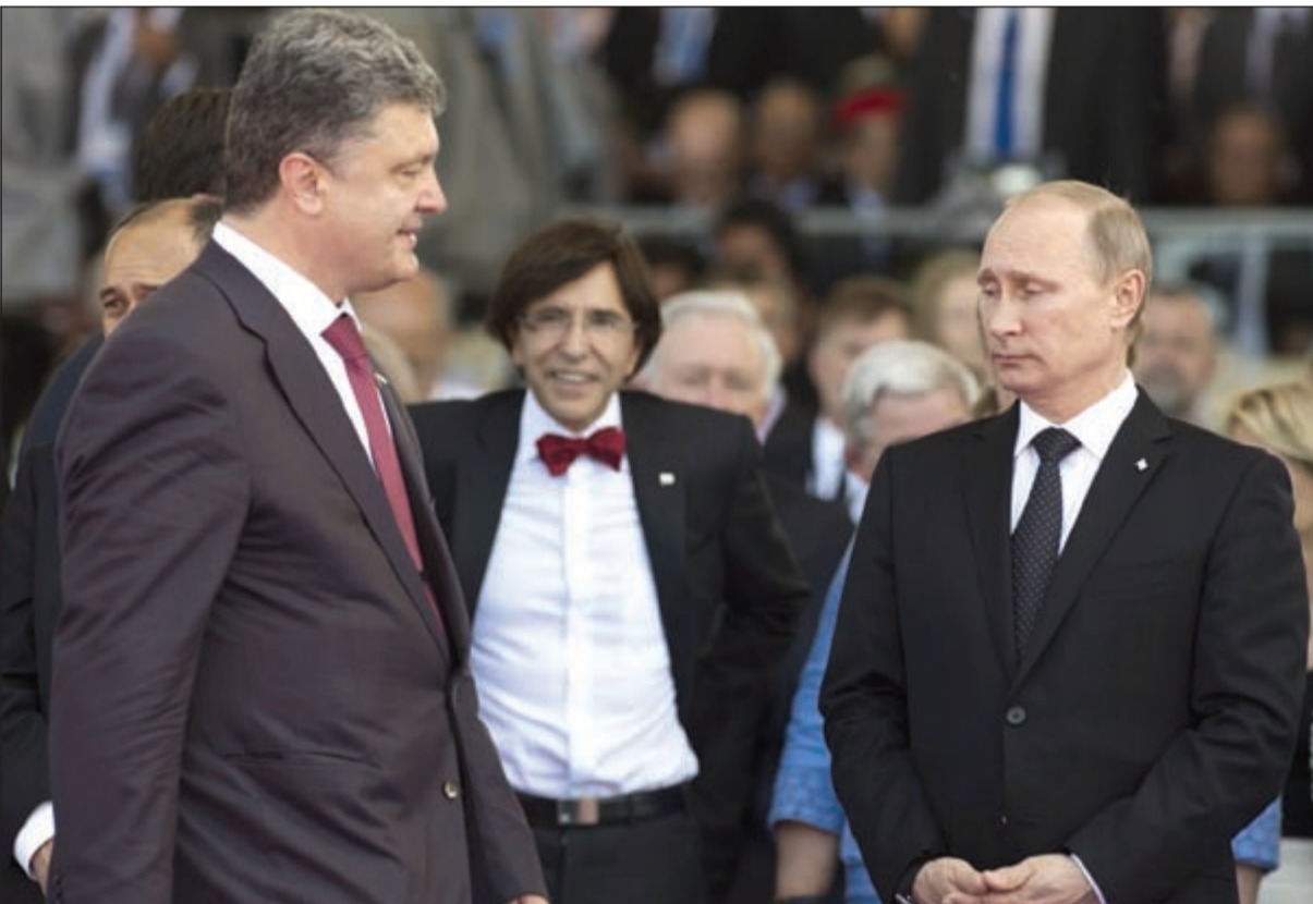
الرئيس الروسي فلاديمير بوتين ونظيره الأوكراني بيتر بوروشينكو عقب لقائهما على هامش احتفالات ذكرى النورماندي أمس (أب).

مع لقاءات ثنائية لقادة دول في الاتحاد الأوروبي مع الرئيس الروسي لحنه على الاعتراف رسمياً بشرعية الرئيس الأوكراني الجديد، مشددين على «المسؤولية الكبيرة» لروسيا في إحلال السلام بأوكرانيا. كما التقى الرئيس الروسي نظيره الأميركي على هامش الاحتفالات ذاتها حيث تحادنا لنحو عشر دقائق، وذلك في أول لقاء بين بوتين وأوباما منذ بدء الأزمة الأوكرانية. من جهة أخرى، قال مصدر بالحكومة الأوكرانية أن أوكرانيا وروسيا ستستأنفان مطلع الأسبوع المقبل المحادثات