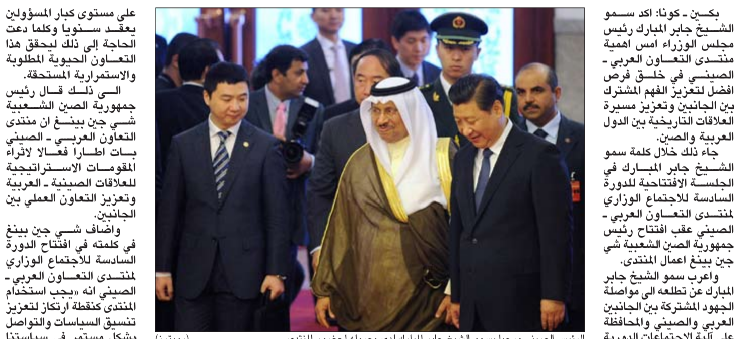
الرئيس الصيني مرحباً بسمو الشيخ جابر المبارك لدى وصوله لحضور المنتدى