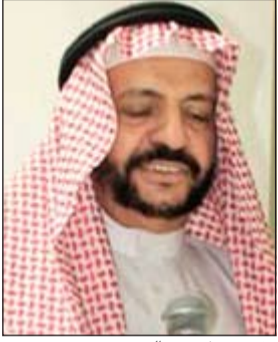
تقديم نبذة عن الصندوق