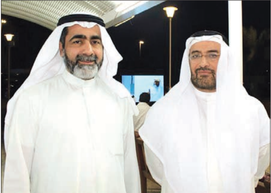
ترحيب بضيوف الديوان

الأسرة و يدعم الأنشطة الاجتماعية الخاصة بعائلة الحسينان. وكانت الانطلاقة منذ ذلك اليوم.