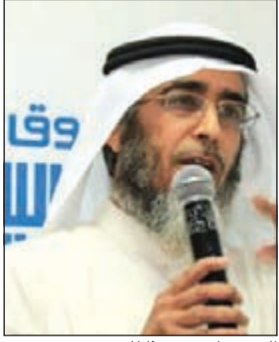
الحسينان متحدثا للحضور