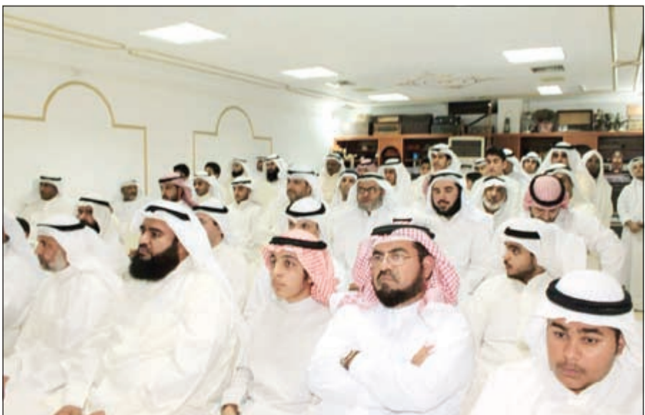
جمع غفير من الحضور

دعم لأفريقيا وللمبعثات الدبلوماسية، خاصة بالشكر وزارة الخارجية التي تقدم لنا كل التسهيلات الممكنة لتيسير مهام عملنا على اكمل وجه وأحسن صورة.