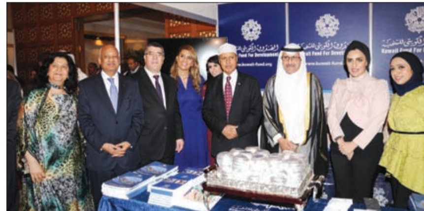
جانب من الجولة في جناح الصندوق الكويتي للتنمية الاقتصادية