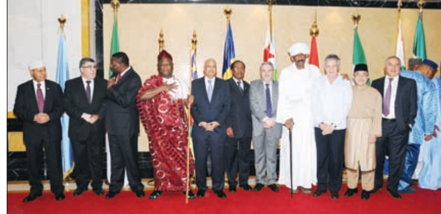
لقطة تذكارية لعدد من السفراء والدبلوماسيين في يوم أفريقيا

وأبدى المنصور حرص الكويت على متابعة القرارات الصادرة عن القمة العربية الأفريقية التي عقدت في الكويت من خلال لجنة تنسيق الشراكة والتي عقدت اجتماعين لها في كل من الكويت والقاهرة،