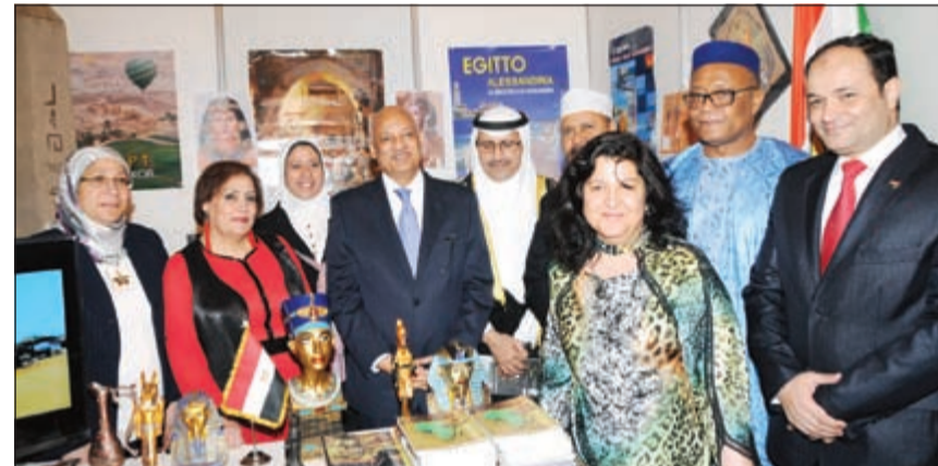
المنصور في الجناح المصري مع السفير عبدالكريم سليمان

مشيراً الى ان اهتمام الكويت بالقارة الأفريقية يأتي انطلاقاً من مواقف الكويت الإنسانية تجاه أصدقائها، ولما تتمتع به القارة من موارد طبيعية ضخمة بالإضافة إلى موقعها الاستراتيجي.