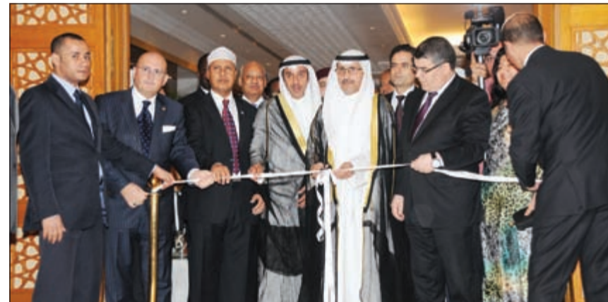
وكيل وزارة الخارجية بالإنابة السفير عبدالله المنصور يفتتح المعرض