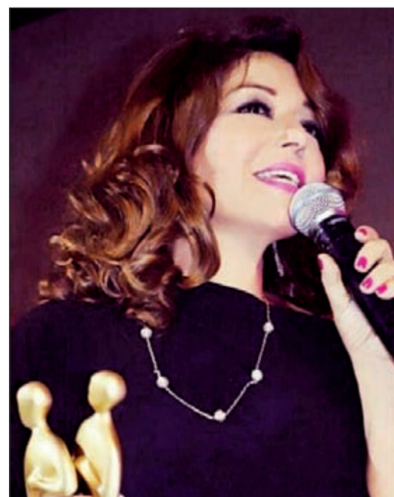
سميرة سعيد بالملابس السوداء