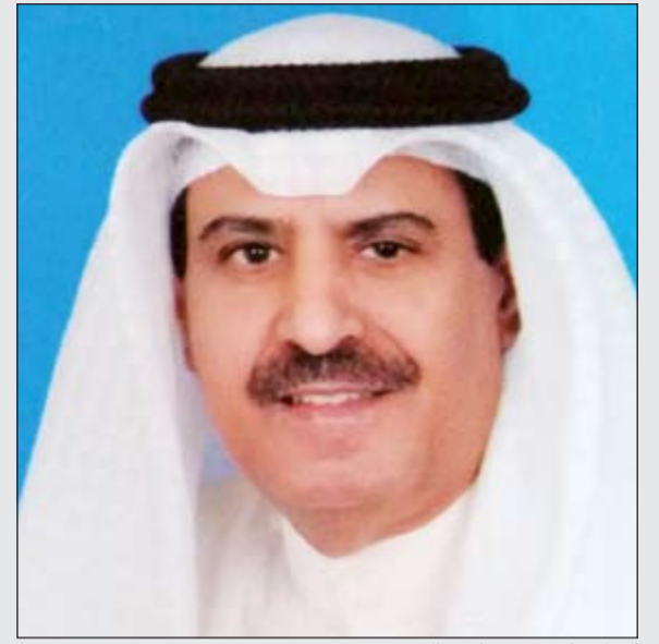
الشاعر المخضرم ناشي الحربي