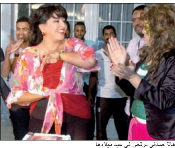
هالة صدقي ترقص في عيد ميلادها

عرضا من بعض رجال الأعمال بتمويل القناة بعد أن تكتشف أن أهدافهم مشبوهة.