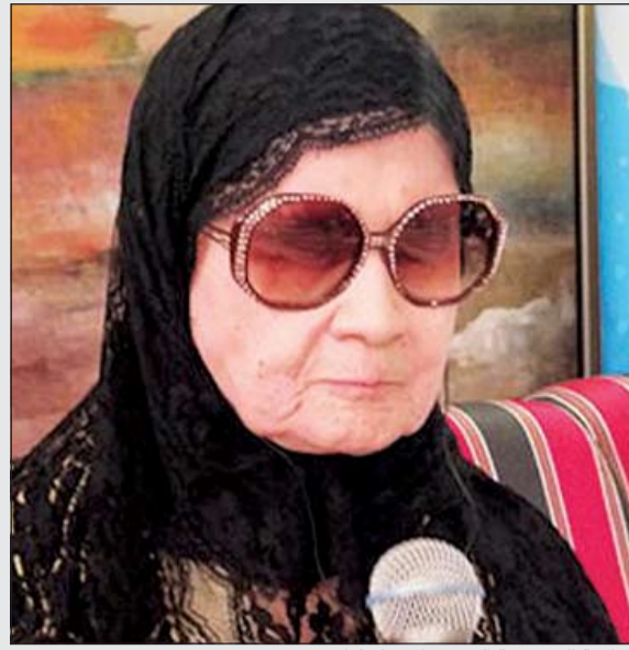
المطربة السعودية القديرة ابتسام لطفى