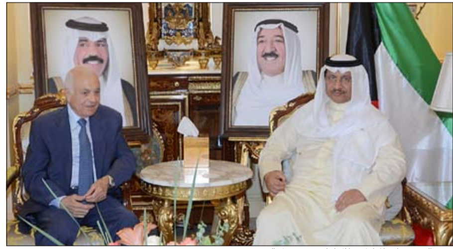
سمو الشيخ جابر المبارك خلال لقائه مع دنيل العربي

خلال اللقاء لمعالجه تحديات وتمنيات معالي رئيس مجلس الأمة مرزوق الغانم للشعب الصيني الصديق بمزيد من التقدم والازدهار. حضر اللقاء أعضاء الوفد الرسمي المرافق لسموه. من جهة أخرى، استقبل رئيس مجلس الوزراء سمو الشيخ جابر المبارك وبحضور النائب الأول لرئيس مجلس الوزراء ووزير الخارجية الشيخ صباح الخالد بمقر إقامته في العاصمة الصينية بكين أمس أمين عام جامعة الدول العربية نبيل العربي. جرى خلال اللقاء استعراض الموضوعات المدرجة على جدول أعمال الدورة السادسة للاجتماع الوزاري للمنتدى العربي - الصيني. حضر المقابلة وكيل وزارة الخارجية خالد الجارالله وعدد من أعضاء الوفد الرسمي المرافق لسموه.