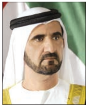
سمو الشيخ محمد بن راشد آل مكتوم