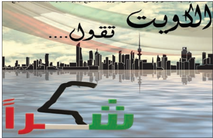
شعار حملة «كفوت تقول شكراً».