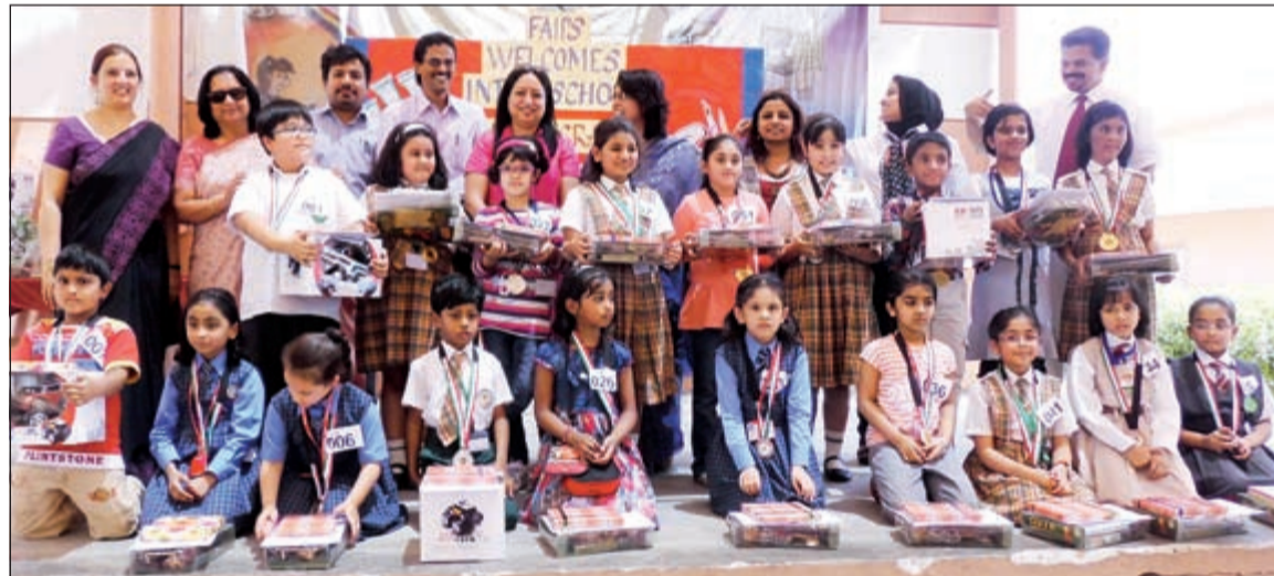
لقطة تذكارية للمشاركين في المسابقة

«أفضل متجر الكتب» بتقديم الهدايا مثل الموسوعات، سيارات التحكم عن بعد والدمى للفانتازين، واختتم اليوم بتوزيع شهادات وهدايا على جميع المشاركين.