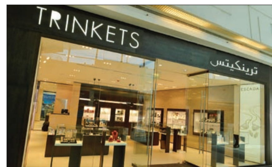
معرض ترينكيتس في الأفنيوز

و Tommy Hilfiger و Armani و Fossil و Michael Kors. وحرصاً على مواكبة مسارات الموضة، فإن كل التشكيلات داخل المعرض يتم تحديثها بشكل شهري ما يتيح للعملاء الاستمرار والتمتع بالسلسلة المستمرة من الإكسسوارات وانتقاء ما يلائمهم. وفي ظل الأسعار المعقولة، يمكن للعميل دوماً تكرار زيارتنا باستمرار لشراء هدية رائعة له أو ليقدّمها لشخص حبيب وعزيز. محلات ترينكيتس موجودة في كل الأماكن في الكويت، الأفنيوز (المرحلة الأولى والمرحلة الثانية)، مارينا، الكوت، الفنار، المهلب، البيرق. TRINKETS تدعموك في المرة القادمة أثناء التسوق التي أن تزورنا في أي من الأماكن لتهدى نفسك قطعة من المجوهرات العصرية وتصاميم رائعة من Emporio