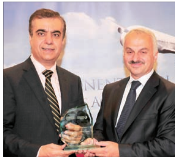
هدية تذكارية عقب توقيع الاتفاقية

في المنطقة، ونحن سعداء للمهمة التي حققناها في عام 2014، في إطار استراتيجيتنا الرامية إلى توسيع نطاق خدماتنا في منطقة الشرق الأوسط، والوصول إلى أسطول يضم أكثر من 500 طائرة في هذه السوق. وتعمل شركة «تيركش تكنيك» حالياً على دعم العديد من أساطيل طائرات «إيرباس» و«بوينغ» لشركات الطيران