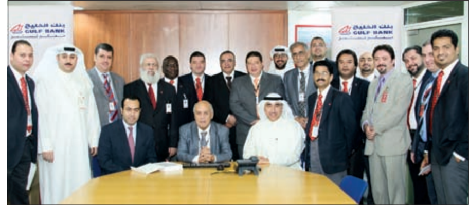
جاناب من الحفل

على ما بذله من جهد ساهم في تسهيل إجراءات البيع لعملاء البنك. كذلك يشكر البنك ممثليه المتواجدين في معارض السائير على عملهم الدؤوب وحرصهم على تقديم