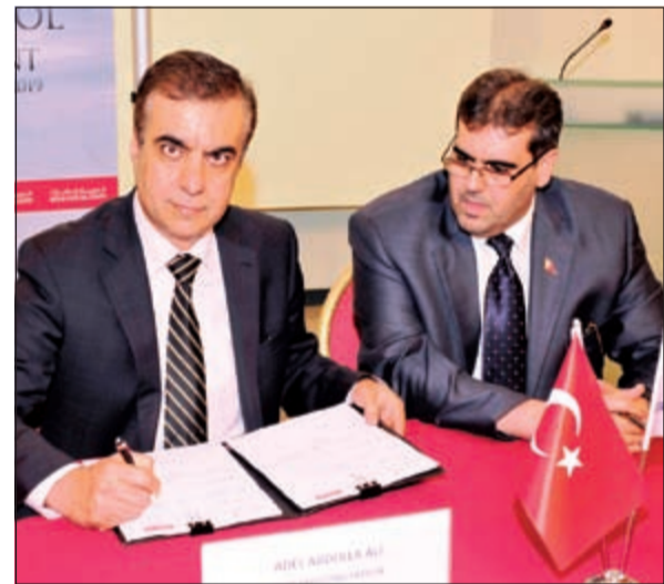
جاناب من توقيع الاتفاقية

الاتفاقية واحدة من الإنجازات المهمة التي حققناها في عام 2014، في إطار استراتيجيتنا الرامية إلى توسيع نطاق خدماتنا في منطقة الشرق الأوسط، والوصول إلى أسطول يضم أكثر من 500 طائرة في هذه السوق. وتعمل شركة «تيركش تكنيك» حالياً على دعم العديد من أساطيل طائرات «إيرباس» و«بوينغ» لشركات الطيران