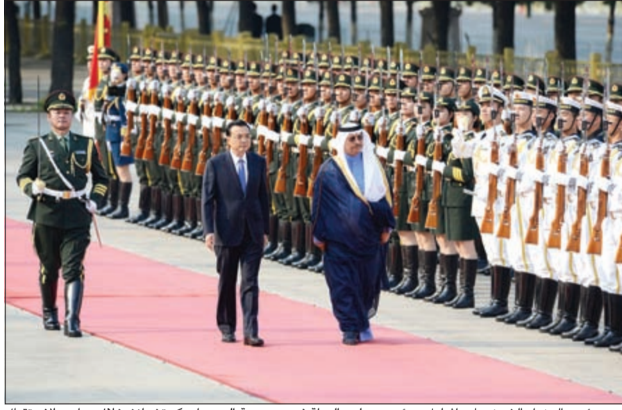
سمو رئيس الوزراء الشيخ جابر المبارك ورئيس مجلس الدولة في جمهورية الصين لي كه تشيانغ خلال مراسم الاستقبال

الوفد الرسمي المرافق لسموه وسفيرنا لدى الصين محمد الذويخ، فيما حضرها من الجانب الصيني عدد من الوزراء وكبار المسؤولين بالصين. هذا وأقام رئيس مجلس الدولة بجمهورية الصين لي كه تشيانغ مأدبة عشاء رسمية بالصاله الغربية من قاعة الشعب الكبرى حضرها