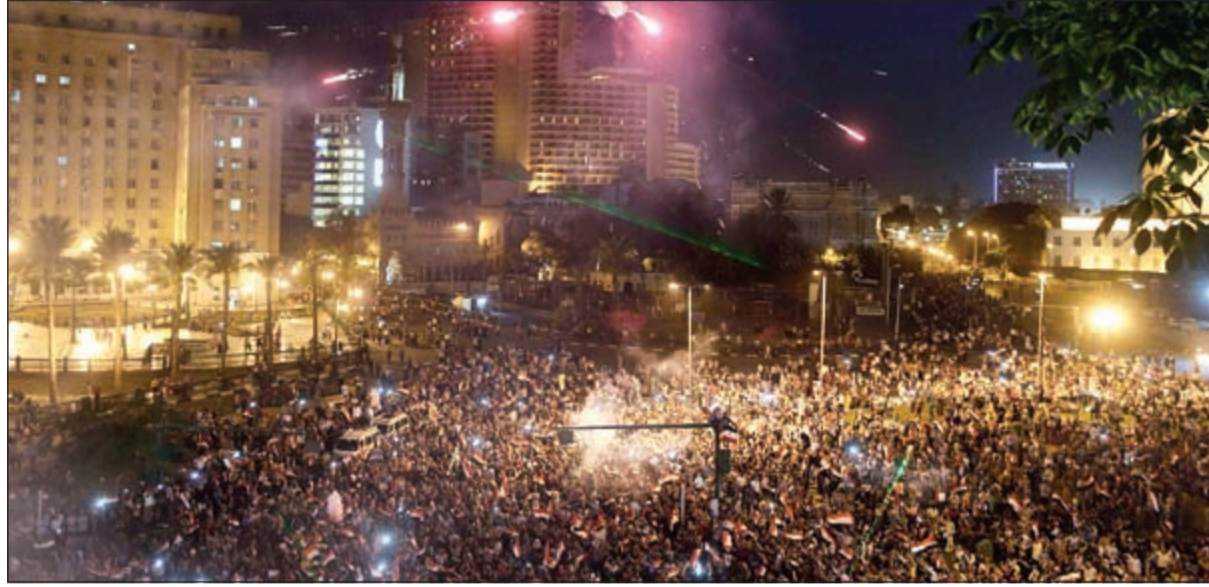
حشود من المصريين يحتفلون بفوز المشير عبدالفتاح السيسى برئاسة مصر في ميدان التحرير بعد إعلان النتائج الرسمية للانتخابات أمس (رويترز)