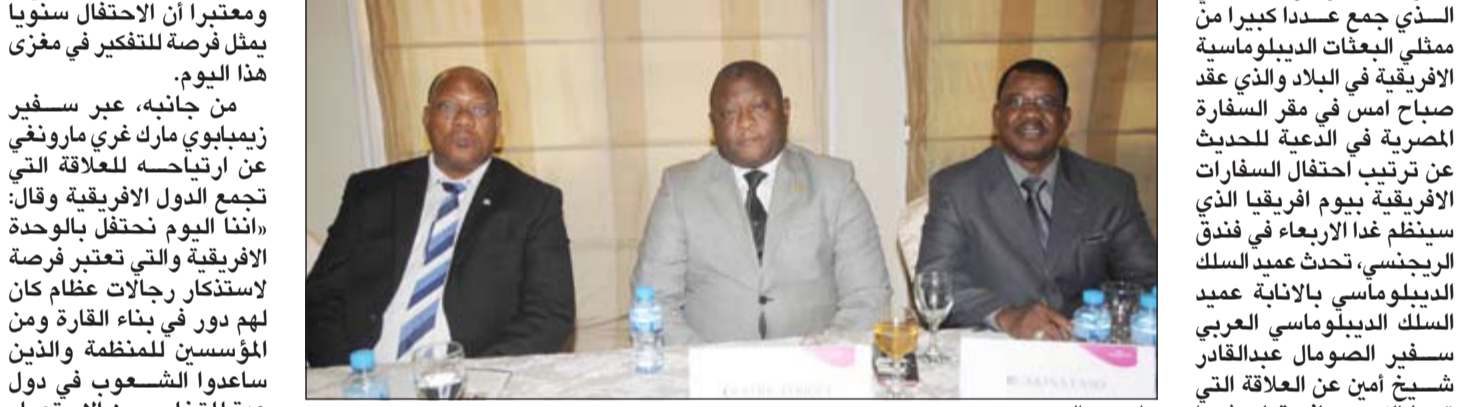
سفراء الصومال ومصر والسودان وزيمبابوي وتونس