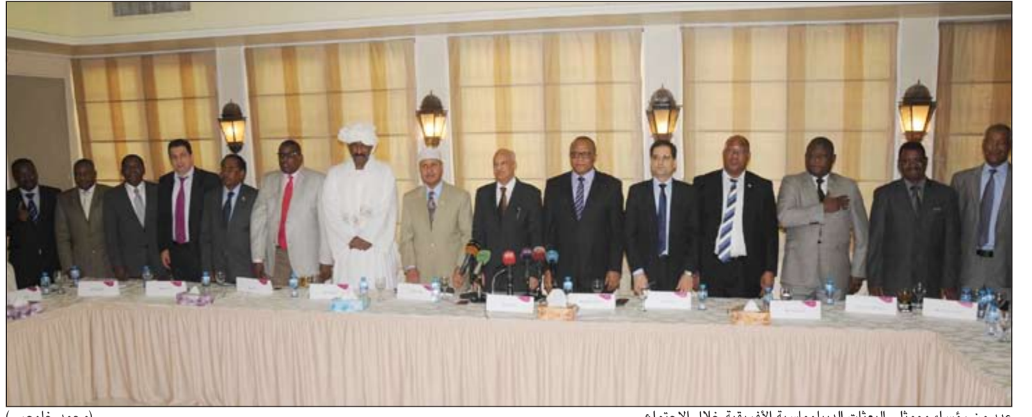
عدد من رؤساء وممثلي البعثات الدبلوماسية الأفريقية خلال الاجتماع