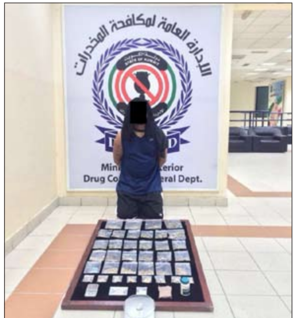
أحد المتهمين وأمامه المضبوطات

وذلك بعد ورود معلومات من أحد المصائد تفيد بأن المتهمين بحوزان ويجرزان سواد مخدرة ومؤثرات عقلية بقصد الاتجار وعلى الفور تم تشكيل فريق لجمع الاستدلالات والقيام بالتحريات وبعد التأكد من صحة وجدية المعلومات تم استصدار الإذن القانوني اللازم، حيث قامت فرقة من إدارة المكافحة المحلية بضبطهما متلبسين وبتفتيش منزلهما تم ضبط نصف كيلو من مادة الماريجوانا و20 جرام من مادة الكوكايين و7 أكياس من مخدر الفطر وبمواجهتهما اعترفاً بأن الكميات المضبوطة تخصهما ويقصد الاتجار والتعاطي فتمت إحالتهما والمضبوطات إلى جهة الاختصاص.