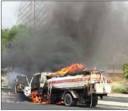
حريق الصهريج خلف سحباً دخانية